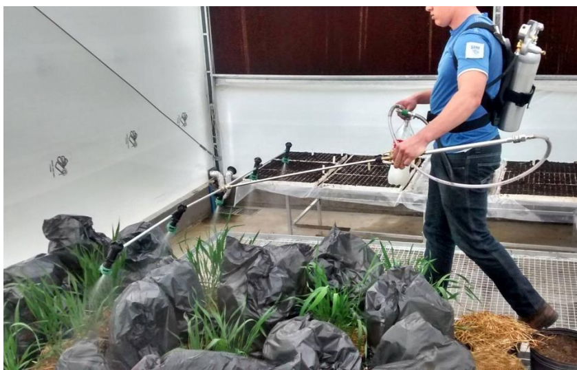
Figura 3. Aplicação do Etil-Trinexapac realizada via pulverização foliar utilizando pulverizador de barras com pressão de CO 2 e bicos do tipo leque. TUREK, T. L. (2014).

(LARGE, 1954). A aplicação será realizada via pulverização foliar utilizando-se pulverizador de barras com pressão de CO 2 e bicos do tipo leque (110-02) (figura 3) ajustado para um volume de calda de 150 L ha -1 . Nos tratamentos sem Etil-Trinexapac, será realizada uma aplicação de água, apenas para uniformizar a superfície de molhamento entre as parcelas, e também as plantas que não devem receber a aplicação de determinadas doses serão envolvidas com um saco plástico para evitar a mistura de diferentes doses. A aplicação será realizada ao final da tarde, com temperaturas amenas e umidade relativa do ar em torno de 70%.