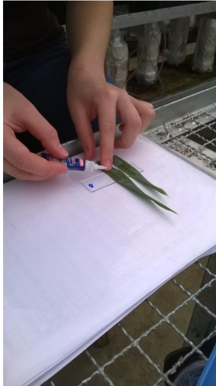
Figura 5. Coleta da epiderme foliar com gotas de cola de secagem instantânea sobre a lâmina. TUREK, T. L. (2014).

Após a secagem, a folha será retirada da lâmina, mantendo-se apenas a epiderme. As lâminas serão fotografadas em laboratório, em microscópio acoplado a uma câmera digital. As imagens obtidas serão analisadas no computador, onde serão determinadas a densidade de estômatos e a área estomática das folhas.