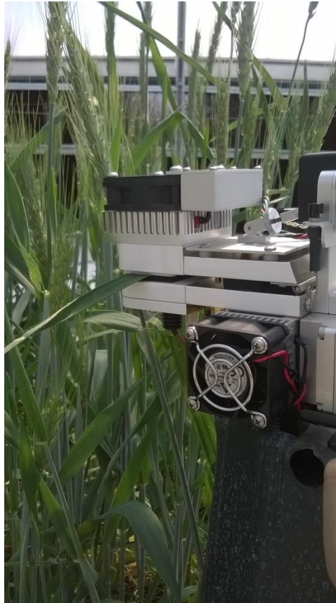
Figura 6. Medidas pontuais realizadas no período de 9h00 e 11h00 da manhã.

resposta à luz ( A/PAR ) e à concentração de carbono ( A/C_i ). Essas medidas serão realizadas apenas na folha bandeira das plantas.