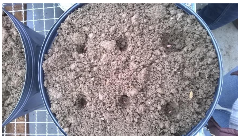
Figura 2. Montagem e semeadura manual das seis sementes por vaso. TUREK, T. L. (2014).

A semeadura será realizada de forma manual, respeitando-se o zoneamento agroclimático da cultura para a região (IAPAR, 2013). Serão semeadas seis sementes por vaso (figura 2), sendo que após a emergência será realizado um desbaste, mantendo-se duas plantas uniformes por vaso. A adubação será realizada de acordo com as características químicas do solo determinadas anteriormente e com as exigências da cultura. A adubação nitrogenada de cobertura será realizada em sete vezes, conforme a necessidade, fase e desenvolvimento da cultura.