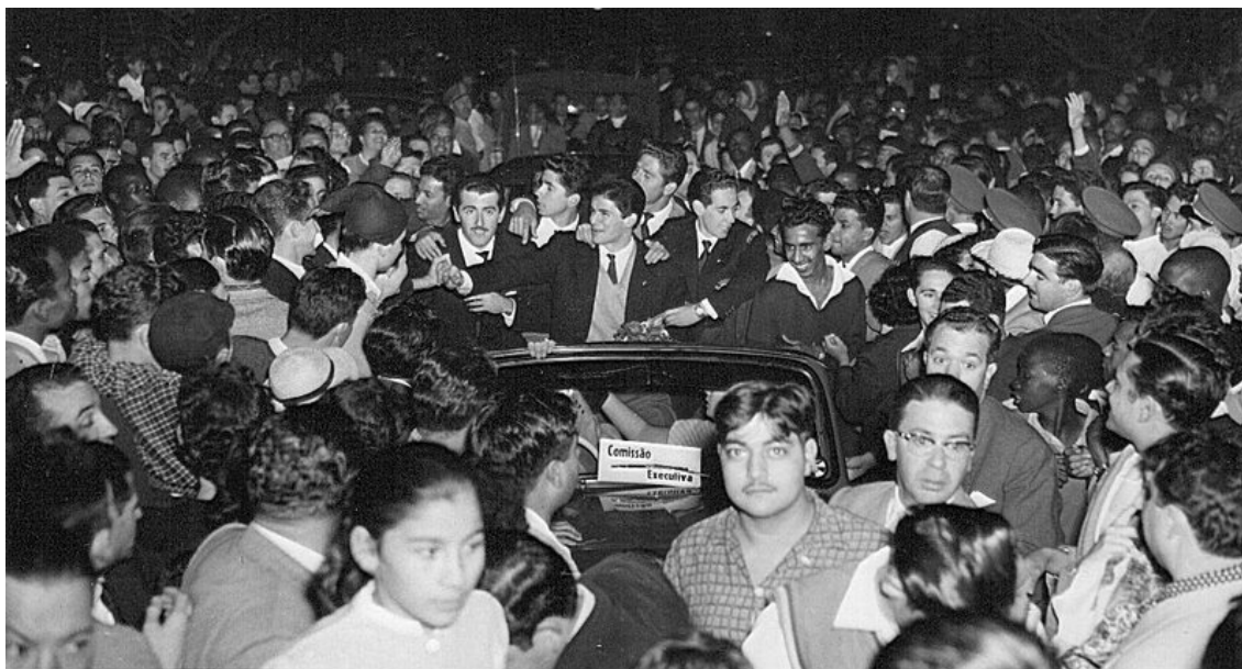
Recepção aos jogadores no Aeroporto Internacional Mavalane, Moçambique.

Na foto a seguir pode-se observar a população em volta dos atletas moçambicanos que parecem até sentir dificuldade de seguir com carro que os levava.