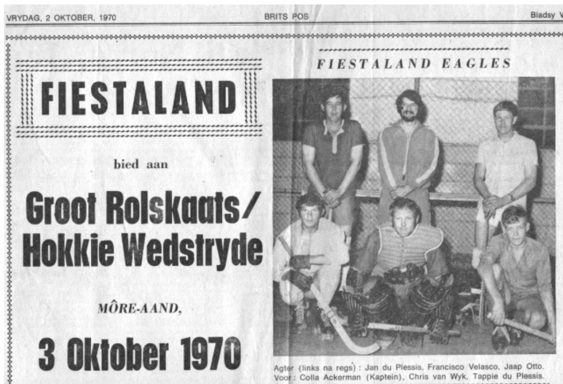
Reportagem do Jornal Britis Pos, sexta feira, 02 de outubro de 1970.

Dessa forma o ex-treinador ganhou a atenção das crianças e Velasco parece se sentir confortável ao ser admirado pelos garotos.