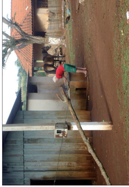
Foto 5. Índio albino lavando roupa em sua casa