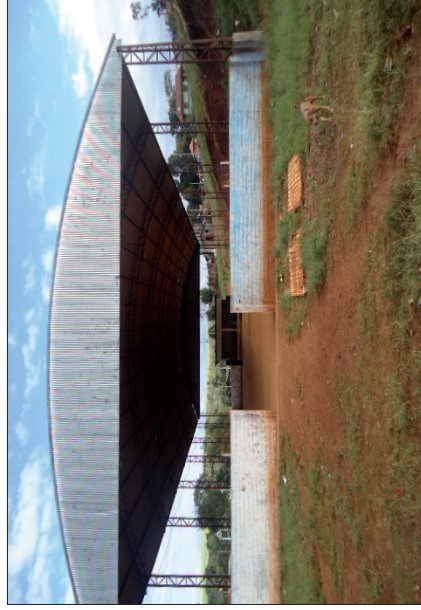
Foto 4. Quadra de esporte