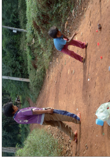
Foto 6. Crianças brincando