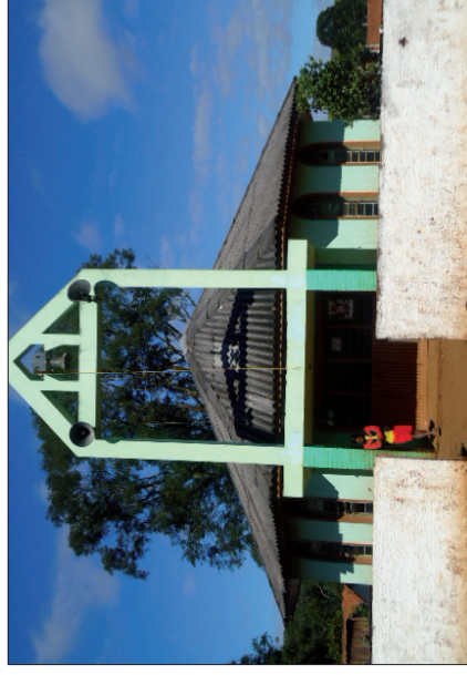
Foto 3. Índia na Igreja