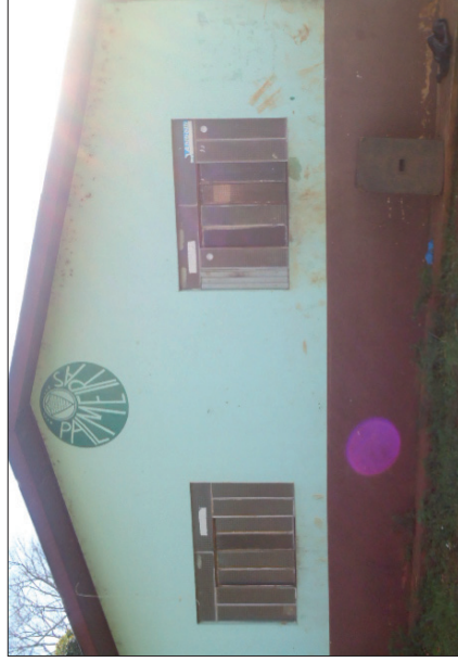
Foto 1. Casa de um dos moradores