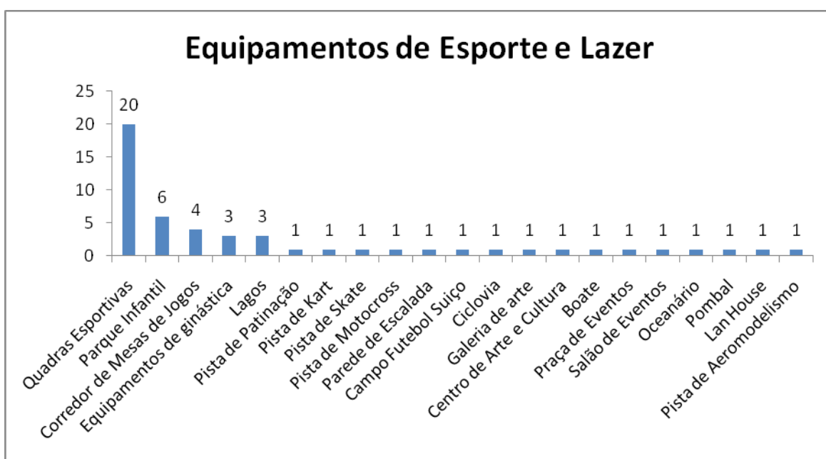
GRÁFICO 1 – EQUIPAMENTOS DE ESPORTE E LAZER DA ORLA

Em relação aos dados, nossa pesquisa possibilitou levantar até o presente momento um total de 52 equipamentos específicos de esporte e lazer, de 21 tipos diferentes, ao longo dos 6 km de extensão da Orla de Atalaia, conforme o gráfico abaixo.