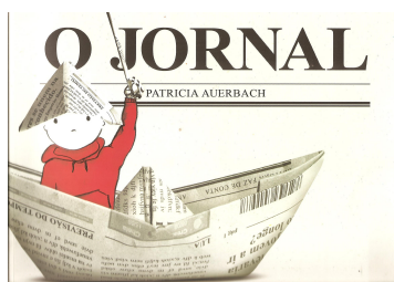
Ilustração 2: Capa do livro de imagem “O jornal”.

Ele começa a ter ideias e criar brinquedos, dobraduras, formas de locomoção, enfim muitas alternativas a partir daquele objeto que inicialmente parecia sem sentido para ele. Assim, o menino utiliza o jornal para arquitetar uma prancha para surfar, um tapete mágico para viajar até um castelo, uma espada e um chapéu para tornar-se um cavaleiro e tantas outras invenções. A história visual permite dar asas a imaginação, proporcionando possibilidades de criação com objetos simples.