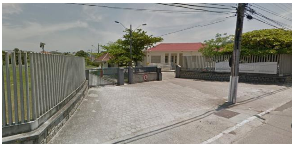
Figura 1 - Superintendência Federal Agropecuária de Santa Catarina.

A Superintendência Federal Agropecuária em Santa Catarina (Figura 1) está localizada no município de São José (Figura 2), no Bairro Kobrasol, e é dividida em setores técnicos e administrativos. O estágio foi desenvolvido no Setor de Fiscalização de Insumos Agrícolas (SEFIA), que conforme o Art. 21 da Portaria 428 de 09/06/2010 executa as atividades relacionadas à fiscalização de insumos agrícolas, tais como agrotóxicos, fertilizantes, corretivos, inoculantes, biofertilizantes, organismos geneticamente modificados, mudas e sementes (BRASIL, 2010).