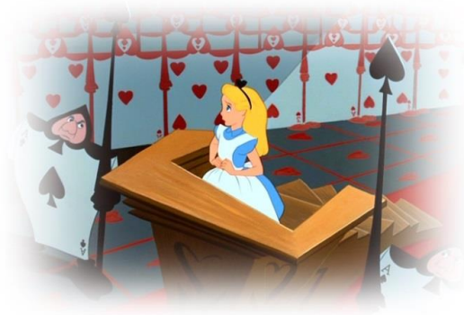
Figura 7: O depoimento de Alice