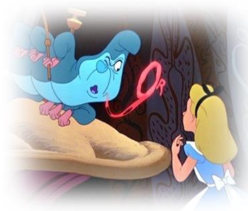
Figura 3: Quem é você?