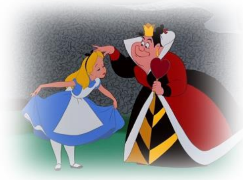
Figura 6: No campo de jogos da Rainha