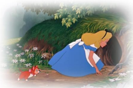
Figura 1: A toca do Coelho