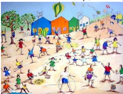
Figura 5: Brincadeiras de criança, Ivan Cruz, 1990.