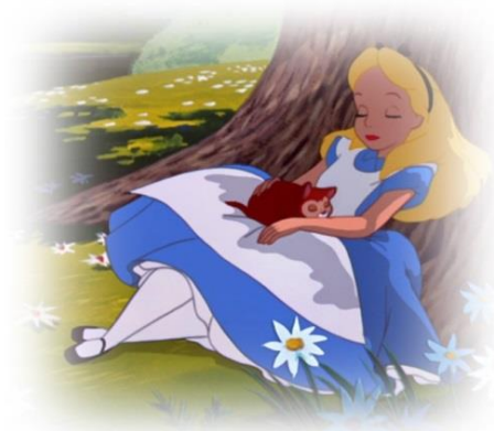
Figura 8: O sonho de Alice