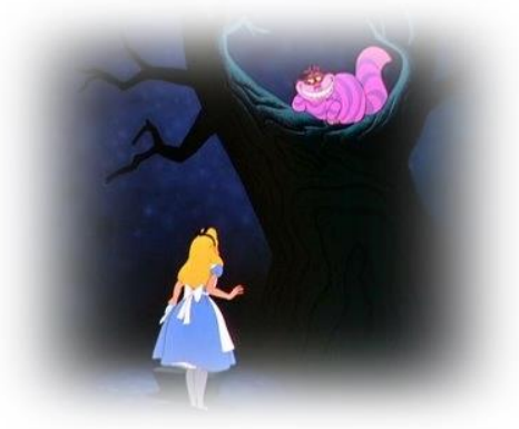
Figura 2: O encontro com o Gato de Cheshire