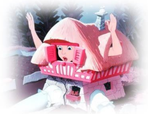
Figura 3: E Alice cresceu rápido demais