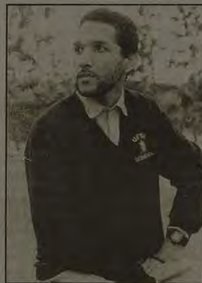
Vigia não vai cortar a barba