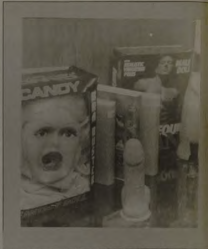
A loja oferece desde vídeos eróticos até chicotes e vibradores

Comércio de produtos eróticos chega a render R$ 7 mil mensais