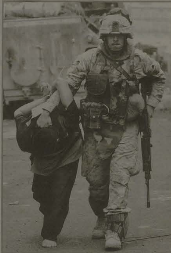
Anja Niedringhaus / AP