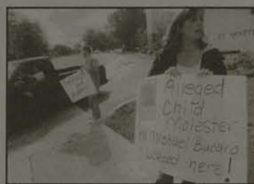
Abuso de menores causa indignação

Um estudo do John Jay College of Criminal Justice, encomendado pela Conferência Americana de Bispos Católicos, revelou que foram 10.667 vítimas de abuso por parte de padres nos últimos 50 anos nos Estados Unidos. Só em 2004, foram 1.092 acusações contra 756 padres. A Igreja Católica