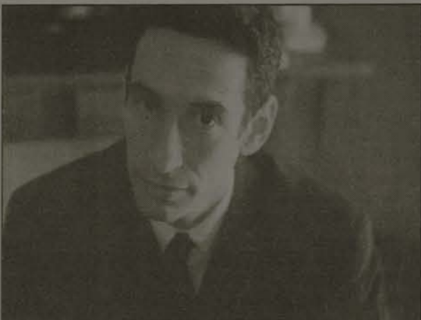
Rushkoff: Meme é uma idéia que se replica como um vírus