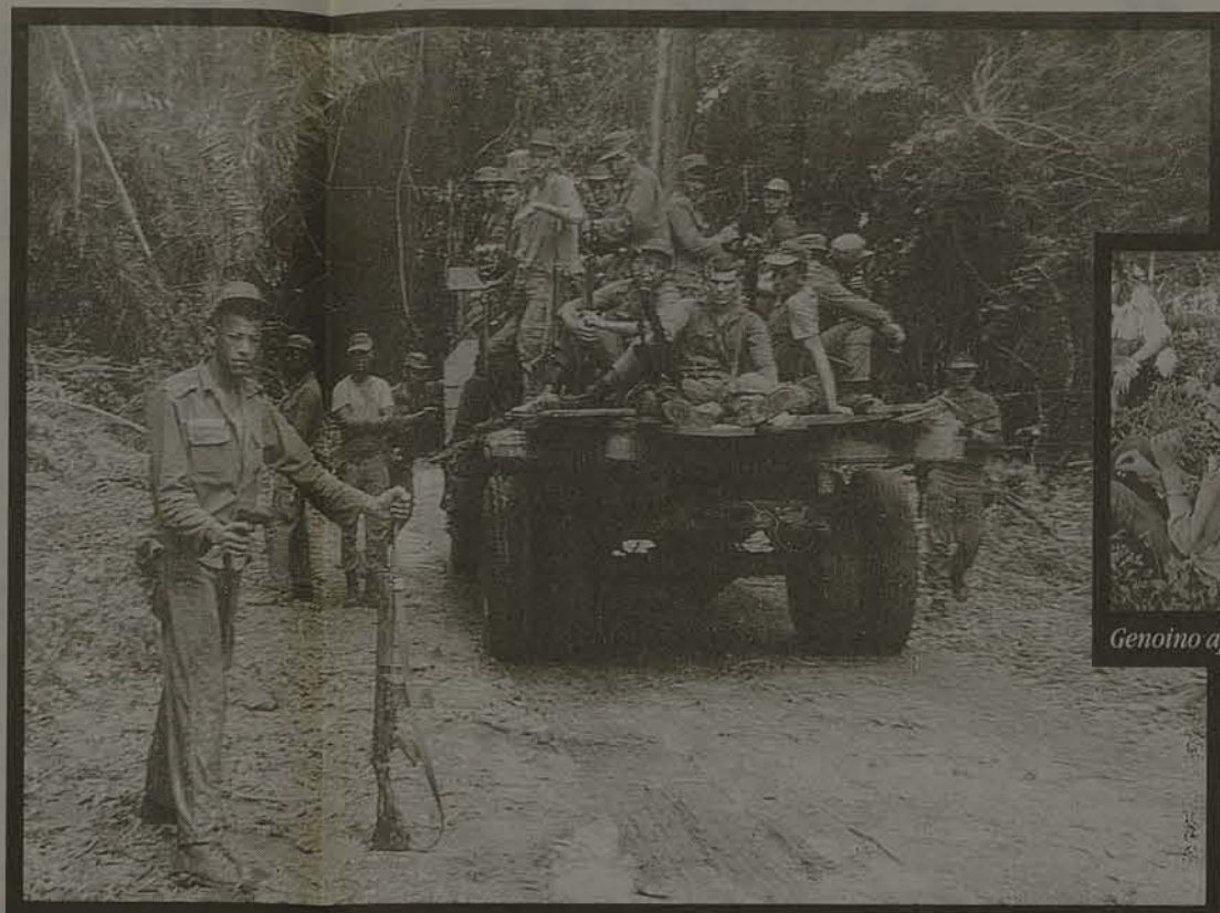
Chegada do exército no Araguaia, em setembro de 1972: imagens revelam momento obscuro da história brasileira

Z- Qual a sua opinião sobre a exigência de indenizações feitas pelos militares? ES - Eu prefiro não opinar, porque esse julgamento não cabe à mim. Não entro no lado dos militares, nem dos guerrilheiros na questão das indenizações, é um julgamento que cabe à legislação. Não quero julgar sozinho.