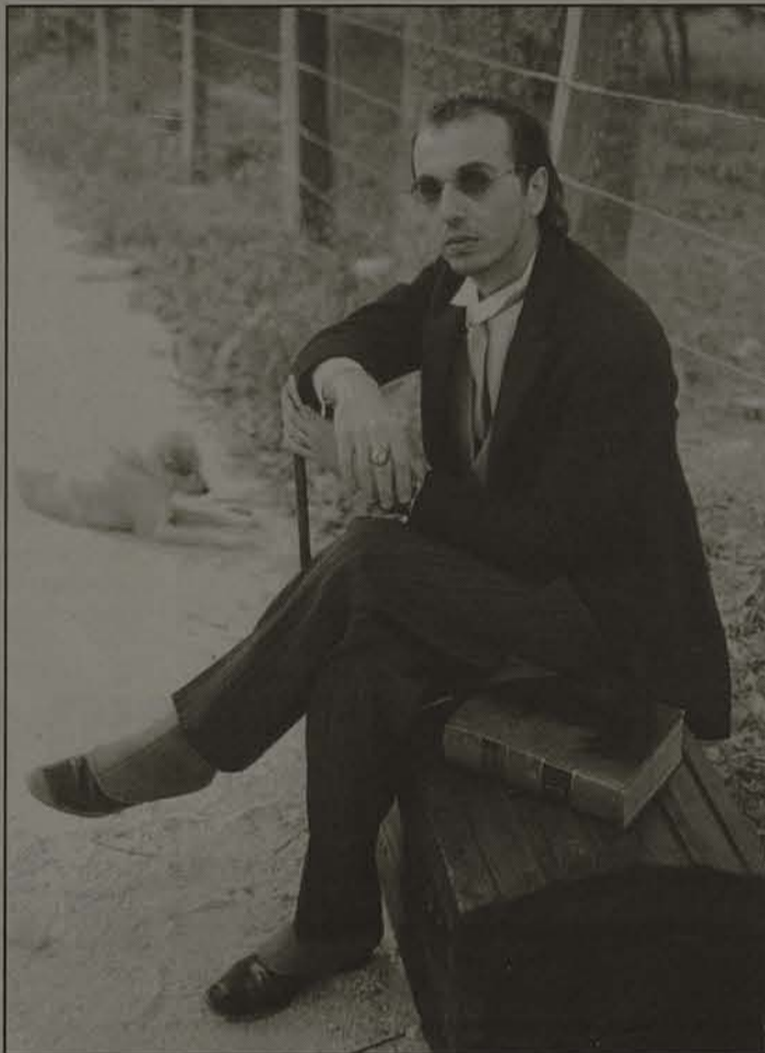
Literatura e poesia beat foram referências para o cantor maranhense

ZB — Eu acho que a canção tem um pouco essa função. O compositor é uma espécie de cronista, né. Se você for pegar a história da música popular, não só da brasileira, mas da música universal, o Bob Dylan é um cronista, Noel Rosa, Chico Buarque. São histórias sendo relatadas com poesia. São histórias do cotidiano, histórias de amor, de sexo, com teor social. Talvez hoje a gente tenha perdido um pouco isso nesses tempos atuais, mas eu prezo muito esse caráter de ler uma