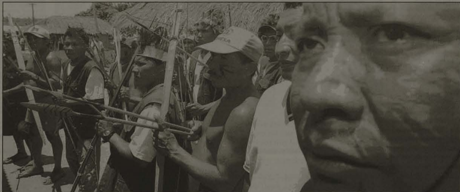
Conflito entre indígenas, fazendeiros e políticos gera medo, violência e preconceito contra povos nativos: Governador decreta luto em repúdio a homologação

mente territórios que já eram considerados áreas indígenas e lá se instalaram. Para eles, a demarcação das terras da reserva deveria ser feita sob a forma de ilhas, ocupando os espaços livres entre suas propriedades. O governo federal, no entanto, optou por demarcar as terras de forma contínua. A reserva indígena Raposa Serra do Sol ficou então com 1,74 milhão de hectares, onde habitam cerca de 15 mil índios, metade da população indígena do estado. O prazo de um ano foi dado aos fazendeiros para que se retirem da área. A medida do governo garante ainda indenização e local para reassentamento dos 565 habitantes dos três vilarejos situados na área indígena. Ambiente tenso- O cenário se tornou ainda mais pesado em Roraima porque os fazendeiros têm fortes relações com os políticos locais e os proprietários de veículos de comunicação. O professor chileno Maxim Repetto, coordenador pedagógico do Núcleo Insikiran, relata que insistentemente as emissoras de rádio e TV, e os jornais locais, na maioria propriedade de políticos e fazendeiros, tomam posições claras contra as questões indígenas e incitam o preconceito contra os