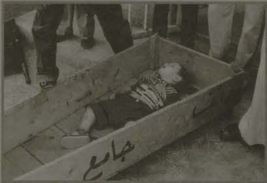
Kaimi Kaamir / AP