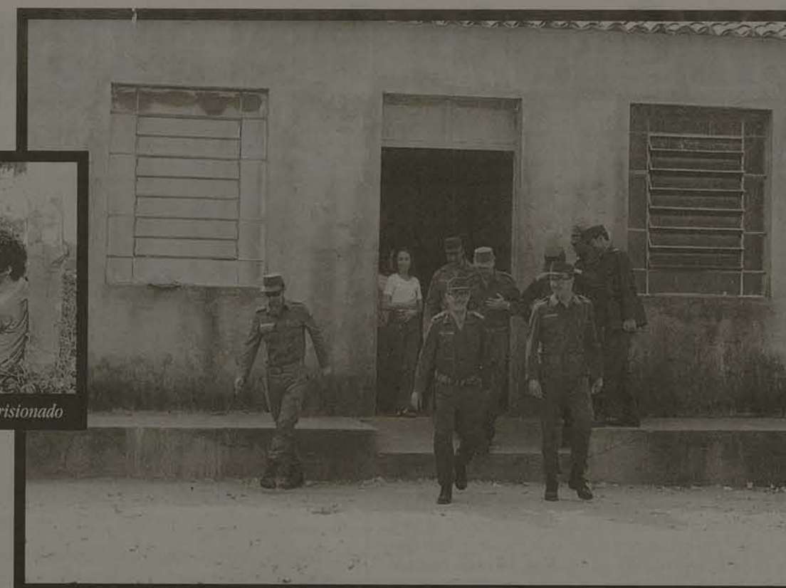
Militares encerram reunião do Estado Maior em Xambioá, em 1972, após discussão de estratégias de combate