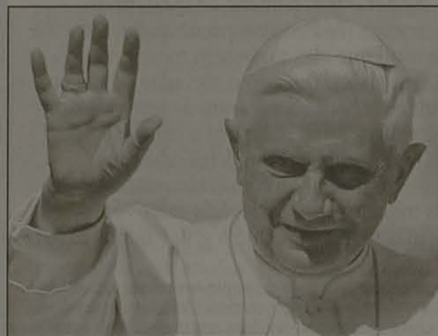
Bento: Conservadorismo é a principal semelhança com João Paulo

Nas questões do mundo e do homem, Bento XVI deve levar ao extremo as opiniões de João Paulo II. Principalmente, com relação ao uso do corpo. Homossexualismo para ele é "uma inclinação que deve ser vista como uma enfermidade". O uso de preservativo nas relações sexuais leva à devassidão: "a proposta do 'sexo seguro' ignora a causa real do problema, a permissividade que, na área do