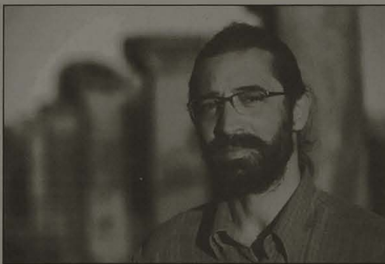
Barros não desiste e exige um "mea culpa honesto, do jornalista e do jornal"

O jornal resolveu se manifestar, publicando uma nota de esclarecimento no caderno Viagem , duas semanas após a reportagem ter sido veiculada. O texto informava que trechos da matéria do dia 14 de dezembro tinham sido "baseados em material fornecido a jornalistas no Paraguai. Três parágrafos,