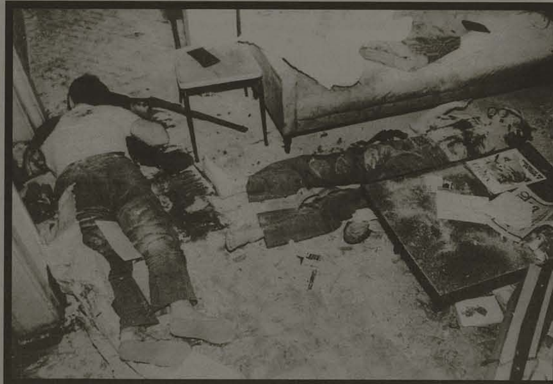
Companhia da Memória