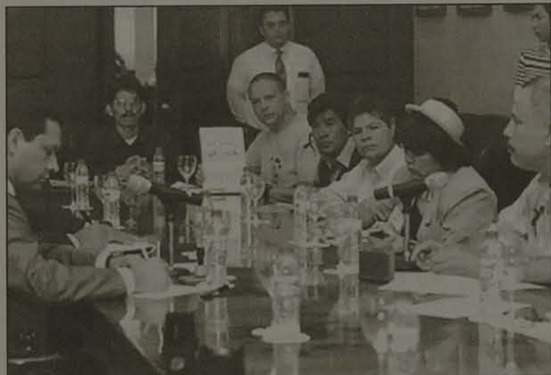
Declarações da Campanha "Ni Uno Más" são entregues para senadores na capital

O presidente Vicente Fox usa como defesa para as acusações de omissão em relação aos presentes atos contra jornalistas o fato de que em seu mandato ele conseguiu abranger ao máximo a liberdade de expressão na imprensa em geral - fato que não pode ser negado. No entanto, essa liberdade só poderá ser usufruída com o fim do medo e das constantes ameaças sofridas pelos jornalistas.