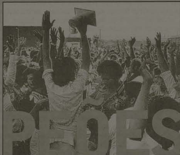
Filme mostra quem lutou no ABC e não virou personalidade