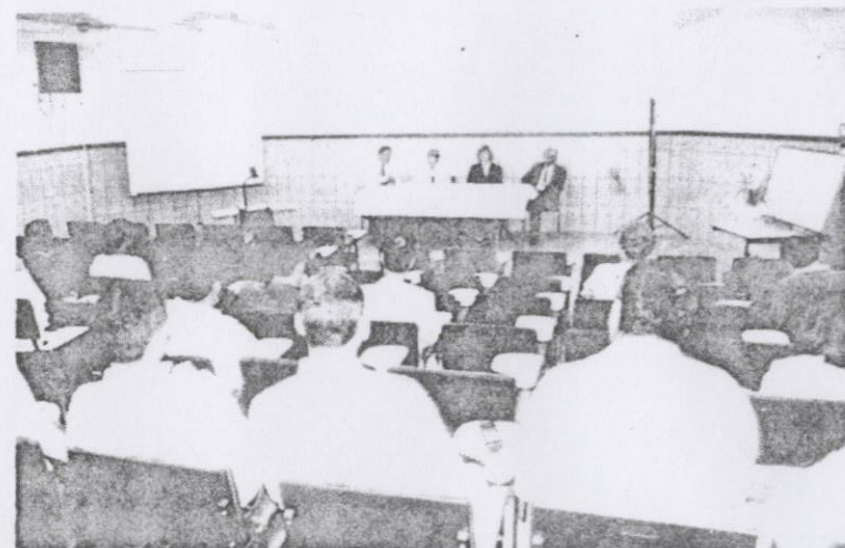
Solenidade: sentando na doação.