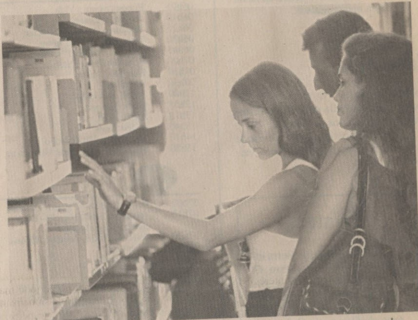
Biblioteca aproveita Semana Nacional do Livro para lançar campanha

Hoje às 8h30min no auditório Elke Hering, haverá a teleconferência "Desmistificando o Marketing e a Comunicação". Entre às 12h30min e às 18horas