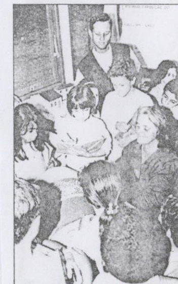
A história para as crianças.