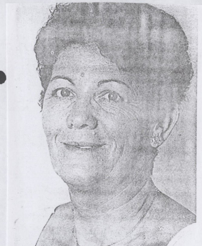
Conceição: "Grito de independência"

PERIÓDICO: Journal Universitário LOCAL: Florianópolis n. 345 v. — data: 24/4/00 p. 4 TÍTULO: Escada da educação