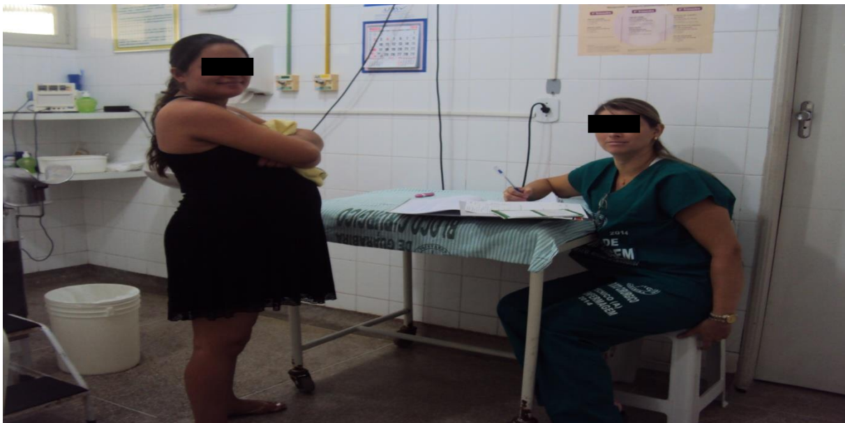
Figura 3. Parturientes no acolhimento inicial pela equipe de Enfermagem.

A população contemplada foram parturientes que utilizam e necessitam do serviço da maternidade na forma de internação hospitalar e/ou observação ambulatorial.