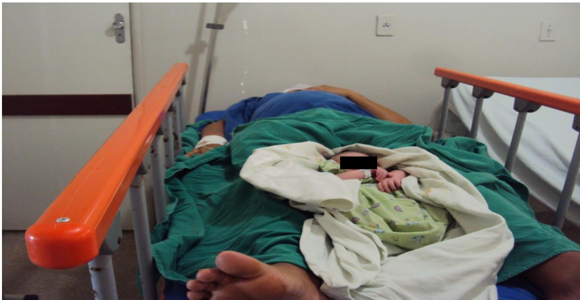
Figura 4. Parturiente no pós parto imediato.

De acordo com a modalidade assistencial escolhida, o produto é o próprio projeto e plano de ação desenvolvido – TECNOLOGIA DE CONCEPÇÃO. Logo, implementamos os históricos de enfermagem existentes naquele setor dando ênfase a Sistematização da Assistência em Enfermagem (SAE) voltados para esta clientela, usando o processo de enfermagem de forma sequencial sugerido pela resolução COFEN número 358/2009, ampliando, organizando, aperfeiçoando -o e readaptando-o as condições apresentadas.