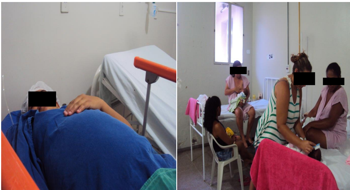
Figura 5. Parturiente no bloco cirúrgico em seguida em alojamento conjunto.

Isso se dará com a diminuição dos riscos sofridos pela parturiente nessa etapa do parto, ocorrendo diminuições nos processos de contaminação, transparência dos serviços oferecidos evidenciado pela sensação de segurança estabelecido pela equipe para com a paciente além de, promover a satisfação da equipe devido ao direcionamento de suas atividades. Essa SAE organizará o serviço, de forma dinâmica e sistematizada, levando em conta as questões legais da profissão através do uso do processo de enfermagem.