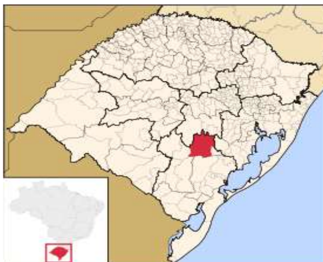
Figura 1. Localização do município no mapa do Estado / RS.