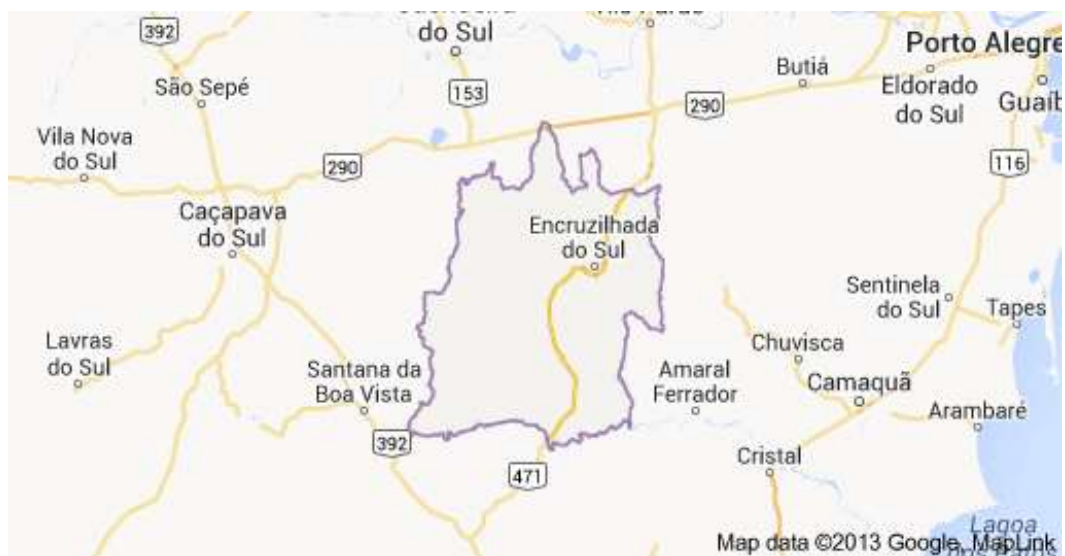
Figura 2. Mapa do município de Encruzilhada do Sul e seus limites.