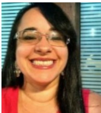
A Gente da BU!

Os preparativos para receber os calouros 2016.2 já iniciaram. A Comissão de Comunicação e Marketing coordena o planejamento de atividades, que para este semestre inclui: a realização de minixposições pelas bibliotecas, o convite e reforço junto às coordenações de curso para que sejam feitas visitas orientadas nas bibliotecas, a disponibilização do manual do calouro e a já tradicional mostra de filmes na Biblioteca Central. As aulas da graduação iniciam em 8 de agosto.