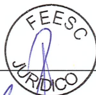
Rogerio Cid Bastos Pró-Reitor de Extensão- UFSC