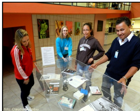
Estudantes preparam exposição