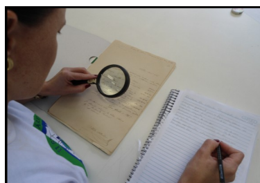
Alunos tiveram a oportunidade de tratar de acervos raros