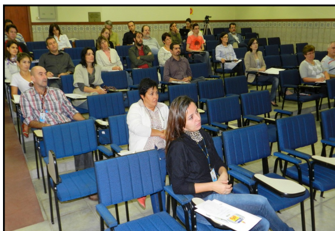
Portal de Periódicos é referência