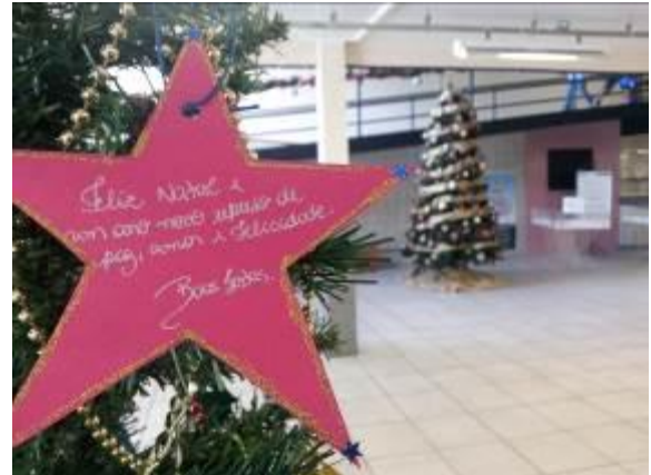
Fotografia 16 – Árvore interativa com os usuários da BU/UFSC