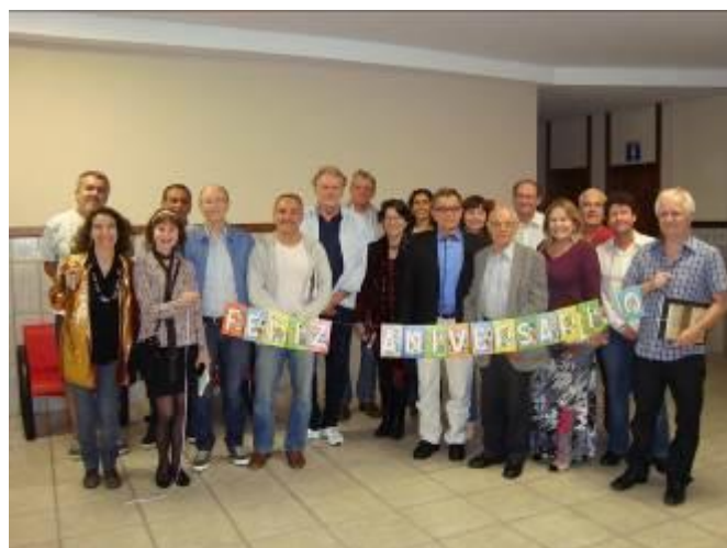
Fotografia 1 - Encontro do Círculo de Leitura de Florianópolis - 10 anos de existência