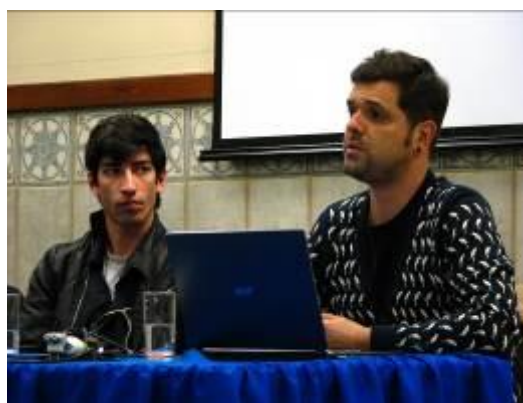
Fotografia 3 - Sessão do Cinema Mundo