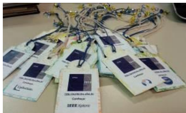
Fotografia 7 - Marcadores de páginas confeccionados