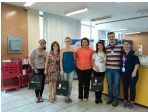
Fotografia 4 - Homenagem aos usuários que mais emprestam livros