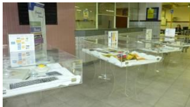
Fotografia 6 - Exposição sobre os produtos e serviços da BU