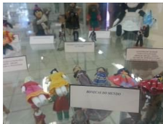
Fotografia 19 – Sinalização renovada no Museu do Brinquedo de SC