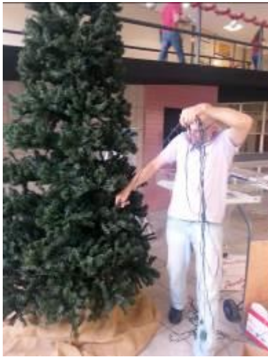
Fotografia 12 – Montando a árvore de Natal no hall da BC/UFSC