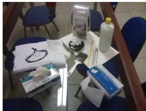
Fotografia 26 – Materiais utilizados no trabalho de higienização das obras raras

Agradecemos as estagiárias pelo brilhante trabalho desenvolvido no setor.