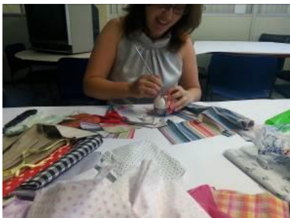
Fotografia 8 - Oficina para confecção de bolas de Natal