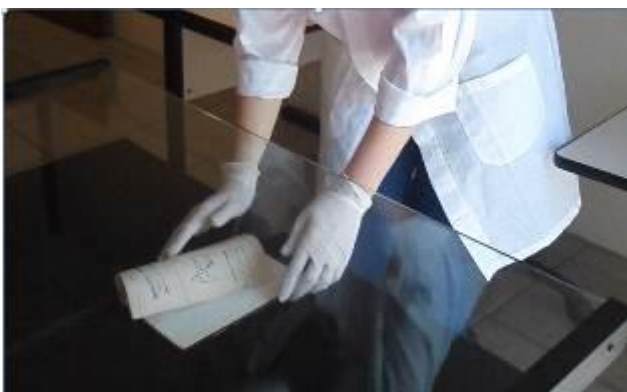
Fotografia 24 – Digitalização das obras raras