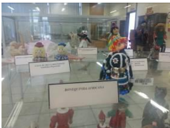
Fotografia 18 – Sinalização renovada no Museu do Brinquedo de SC