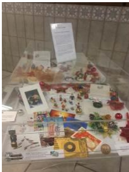
Fotografia 14 – Exposição sobre o Natal no hall da BC/UFSC