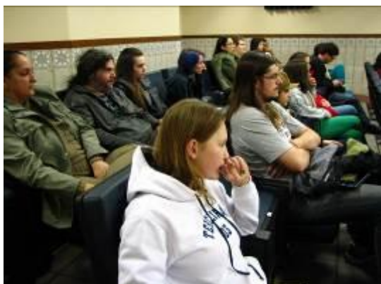
Fotografia 2 - Sessão do Cinema Mundo