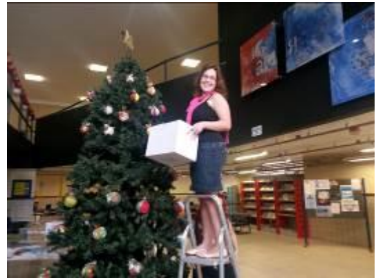
Fotografia 15 – Montando a árvore de Natal no hall da BC/UFSC