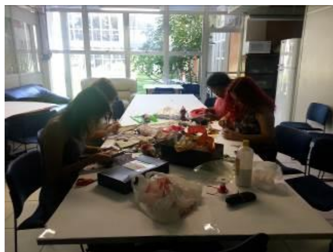
Fotografia 11 - Oficina para confecção de bolas de Natal