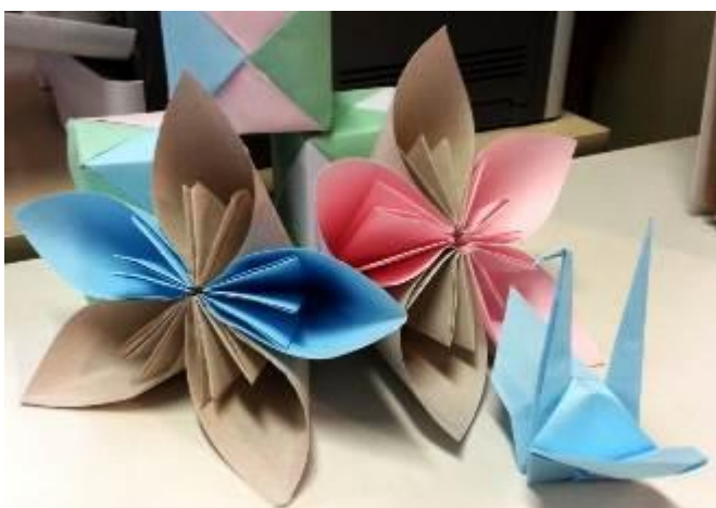
Fotografia 5 - Oficina de Origami