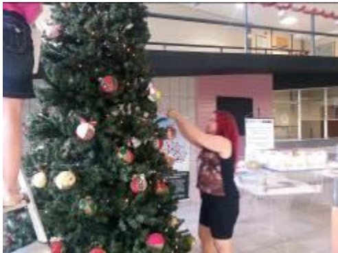
Fotografia 13 – Montando a árvore de Natal no hall da BC/UFSC