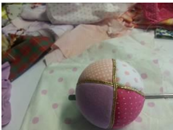
Fotografia 9 - Oficina para confecção de bolas de Natal