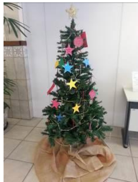
Fotografia 17 – Árvore interativa com os usuários da BU/UFSC