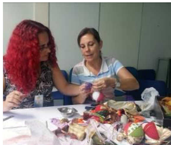
Fotografia 10 - Oficina para confecção de bolas de Natal