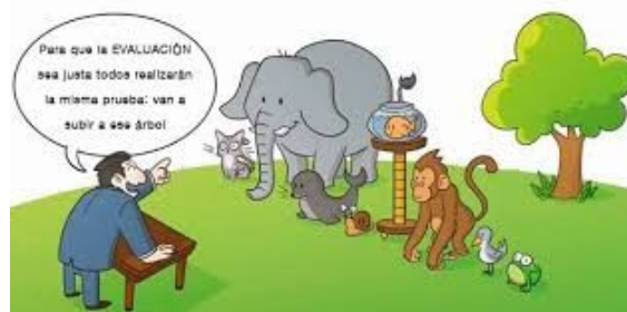
Ilustración 2. Educación Justa.

Veremos el reflejo fiel de la desigualdad en el ámbito educativo y la falta de equidad y justicia al evaluar, habilitar, certificar y acreditar la ES en Paraguay sin tener presente los tipos de inteligencia y capacidades innatas a desarrollar o cuarteadas, muy común en países de América, Se percibe: mal enfoque en direccionamiento, seguimiento y gestión administrativa actual (MEC, CONES. ANEAES) y los encargados de velar por la educación en PY y de instituciones tanto públicas como privadas con visión igualitaria, no por tiempo de existencia o por clasismo social. La preocupación mayor debe centrarse en los resultados de los actores principales “El estudiante, el docente” la matriz base y la materia prima del Servicio en la ES.