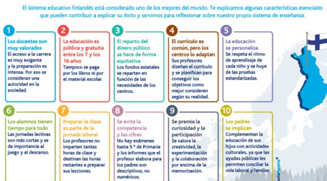
Ilustración 310 claves de la educación en Finlandia.

Esta investigación tuvo un diseño no experimental, investigativo, con enfoque mixto, cualitativo. Por sus propósitos y alcance, y cuantitativo por los datos estadísticos comparativos la metodología fue exploratoria y descriptiva. El estudio en Paraguay con información de Países de América y Europa con el paralelo Paraguay vs Finlandia El universo de este estudio comprende instituciones, modelos Educativos, pedagógicos mundiales de tipo investigativo, tienen estudios certificados (Sampieri, 2010)