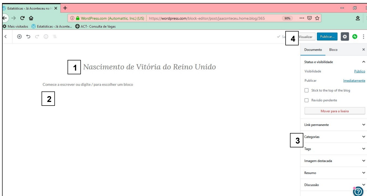
Imagem 3: Página direcionada para escrita de textos (posts)

Na imagem 3, pode-se ver a página de criação efetiva para o blog. Para criar um post, primeiramente deve-se escolher um título (1). Neste caso, a autora optou por escrever sobre o “Nascimento de Vitória do Reino Unido” no dia 24 de maio de 2019 (Rainha Vitoria nasceu neste mesmo dia do ano de 1819). Após isso, no campo abaixo (2) há o espaço para a escrita em si. Neste espaço, pode-se além de colocar textos, colocar imagens e vídeos. Não existe limite para o tamanho do texto, e sua organização do mesmo também pode ser variada. Já no menu à direita (3) estão as complementações para o post, como, por exemplo, em que categoria está o post e quais são suas tags (palavras-chave que facilitam a pesquisa para o usuário do site) e qual a imagem principal da postagem, que será visível na página principal do blog.