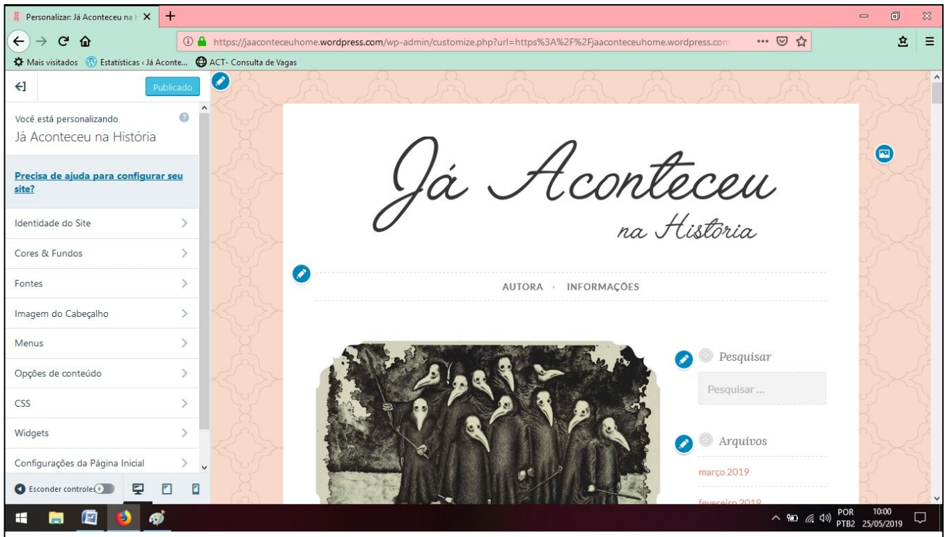
Imagem 2: Personalização da página.

A imagem 2 exemplifica como é o momento da personalização do blog. Na barra de menu a esquerda da tela, há vários itens personalizáveis, como a identidade do site, onde o autor pode criar sua própria logo e inserir acima, conforme foi feito no “Já aconteceu”. Após isso, o autor pode alterar “Cores e Fundos”, “Fontes”, “Imagem de cabeçalho”, “Menus”, “Opções de conteúdo” etc. No item “Widgets”, estão disponibilizados vários itens optativos que auxiliam tanto o autor do blog quanto seus leitores e são, como por exemplo, os itens “Pesquisar” e “Arquivos”. Esses itens foram inseridos à página inicial do blog pela própria autora e auxiliam o leitor a procurar postagens de acordo com sua preferência. Todos esses itens personalizáveis podem ser alterados a qualquer momento, como a cor de fundo no site ou o logotipo principal.