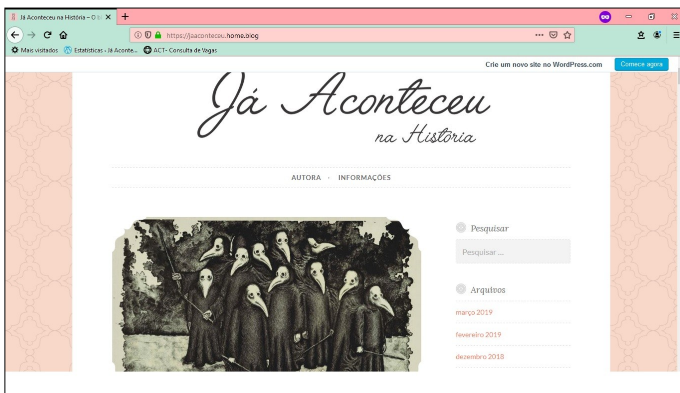
Imagem 5: Página inicial do blog, do ponto de vista do leitor

Como já citado, o blog tem inúmeras possibilidades de criação. A personalização é ilimitada (no caso do WordPress) e, no momento da escrita dos posts, vários são os formatos que podem ser utilizados, com imagens e vídeos, por exemplo. É importante, porém, ter em mente a facilidade no momento da leitura, então a clareza e a organização das postagens são fundamentais. A imagem 5 mostra a página principal do blog, do ponto de vista do leitor: