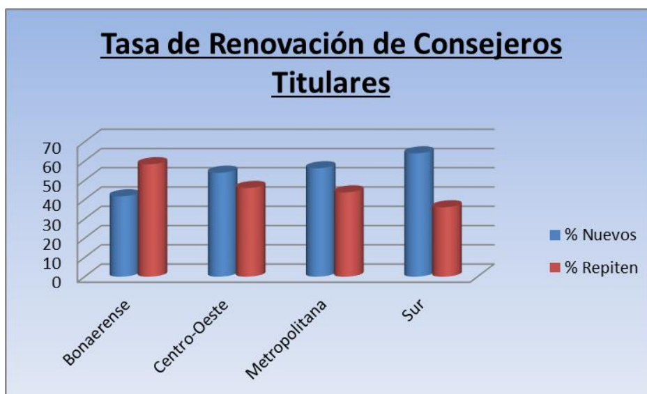
Gráfico N° 4: Tasa de renovación de Consejeros Titulares del claustro docente en los Consejos Superiores, de una muestra de Universidades Nacionales Argentinas, según Región CPRES”

En el gráfico N°3, podemos observar que para las regiones Centro-Oeste, Metropolitana y Sur la tasa de renovación de los consejeros del claustro docente en los Consejos Superiores es, en promedio, del 71%, con una media del 62%. En la región Bonaerense el fenómeno es inverso al observado en las demás regiones, la tasa de renovación es superior para quienes reiteran el mandato (52,78%) que para quienes por primera vez asumen dicha función (47,22%). Tal como lo hicimos al agrupar por tamaño de la institución, analizamos ahora la tasa de renovación solo para los consejeros titulares.