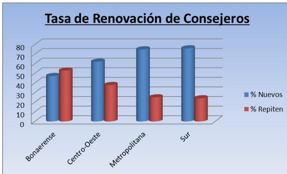
Gráfico N° 3: “Tasa de renovación de Consejeros del claustro docente en los Consejos Superiores, de una muestra de Universidades Nacionales Argentinas, por región CPRES”

Agrupamos a las instituciones en función del CPRES de pertenencia para realizar el mismo análisis que acabamos de presentar en función del tamaño de la institución.