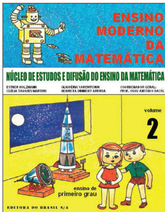
Figura 4. Capa Livro do NEDEM para o Primário – Volume 2. (NEDEM, 1971).

[...] nas capas das edições para os anos iniciais de escolaridade, imagens que fazem alusão ao desenvolvimento tecnológico que era vivido naquela época; além das imagens e dos textos introdutórios que evidenciam o progresso da tecnologia, desenhos de foguetes e robôs são marcas das publicações didáticas que foram produzidas por seus membros para uso nas escolas.