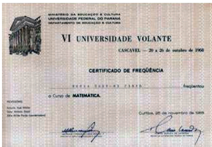
Figura 1. Certificado do curso de capacitação e aperfeiçoamento.

Em 1965, uma iniciativa da Universidade Federal do Paraná promoveu a realização de cursos de capacitação e aperfeiçoamento para professores da região oeste do estado. Sediada na cidade de Cascavel, dentre os cursos oferecidos pela Universidade Volante destaca-se o Curso de Matemática, ministrado pelo Professor Osny Antonio Dacol, que abordou a Matemática Moderna ensinando os professores do Curso Ginásial a trabalharem com os Blocos Lógicos (figura 1).