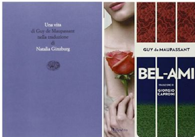
Maupassant traduzido por Natalia Ginzburg e Giorgio Caproni, respectivamente

Caproni também traduziu Maupassant (Bel Ami, 1965), Céline (Morte a Crédito, 1964), Apollinaire (Poesie, 1979), Jean Genet (4 Romanzi, 1975), entre outros. Ginzburg também foi tradutora de alguns autores franceses, como Maupassant (Una Vita, 1994), Flaubert (La Signora Bovary, 1983), Marguerite Duras (Suzanna Andler na coleção Collezione di Teatro, 1987), Vercors (Il Silenzio del Mare, 1945), entre outros.