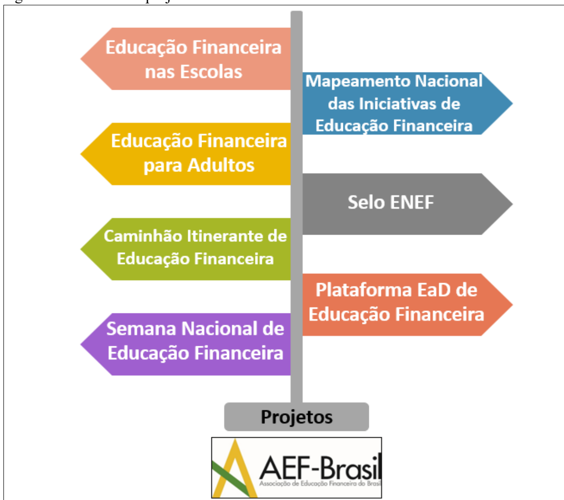
Figura 2 - Portfólio de projetos da AEF-BRASIL.