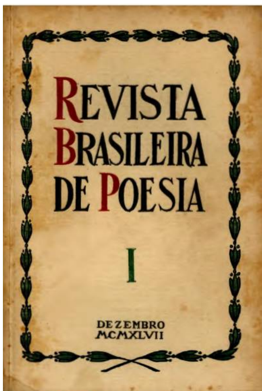
Figura 1: Capa da Revista Brasileira de Poesia nº 1. Acervo de Maria Lucia de Barros Camargo. 1947.

Diante dos olhos, uma capa de revista amarelada pelo tempo onde se inscrevem os caracteres REVISTA BRASILEIRA DE POESIA em preto, a não ser pelas iniciais em vermelho, que convidam a assim apelidá-la: RBP. Sua aparência é austera: capa sem ilustração não fosse uma tímida margem florida. O contorno começa, se considerarmos que antes da pétala vem o caule, pela margem inferior, onde dois caules se cruzam e dão origem a corolas que se repetem enfileiradas. Além da seriedade das letras maiúsculas do título (e que possuem serifa, note-se), algarismos romanos informam a edição: primeira. E a idade: MCMXLVII, 1947. Olhos mais distraídos diriam que essa austeridade se justificaria por ser o periódico uma revista dos anos 1940, e passariam à folha de sumário sem maior estranhamento. Olhos mais especializados associariam essa austeridade não a uma