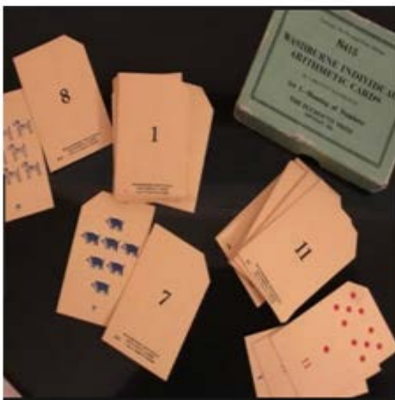
Figura 1 - Washburne individual Arithmetic Cards, N415.

Para Washburne, o fracasso em aritmética era oriundo da insuficiência do desenvolvimento mental e do domínio inadequado da ‘fundação do conhecimento’ de noções básicas, como números e operações. Pensando nisso, ele criou um conjunto de cartas para trabalhar o conceito de número (Figura 1), tendo em vista que os anos iniciais seriam dedicados à passagem da objetivação do ensino para as primeiras abstrações. E outro conjunto (Figura 2) para trabalhar nas três primeiras séries com as combinações mais fáceis das operações de adição e subtração.