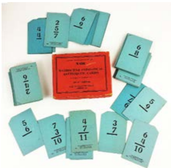
Figura 2 - Washburne individual Arithmetic Cards, N416.