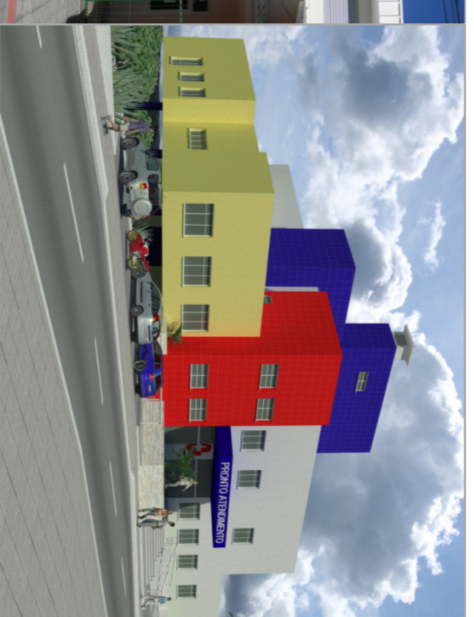
Simulação UPA Continente