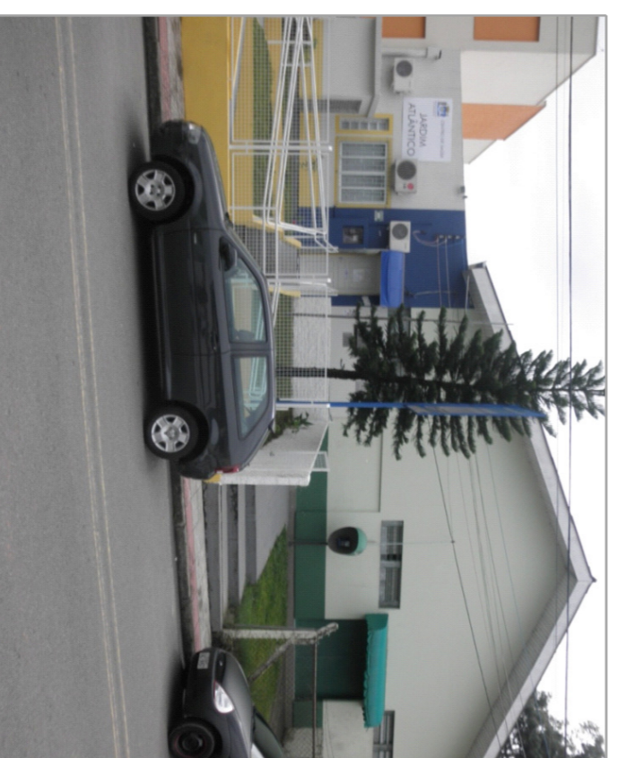
Centro de Saúde