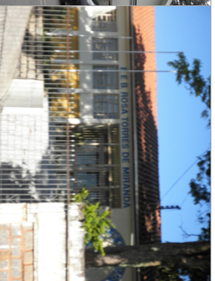
Escola estadual Rosa Torres de Miranda