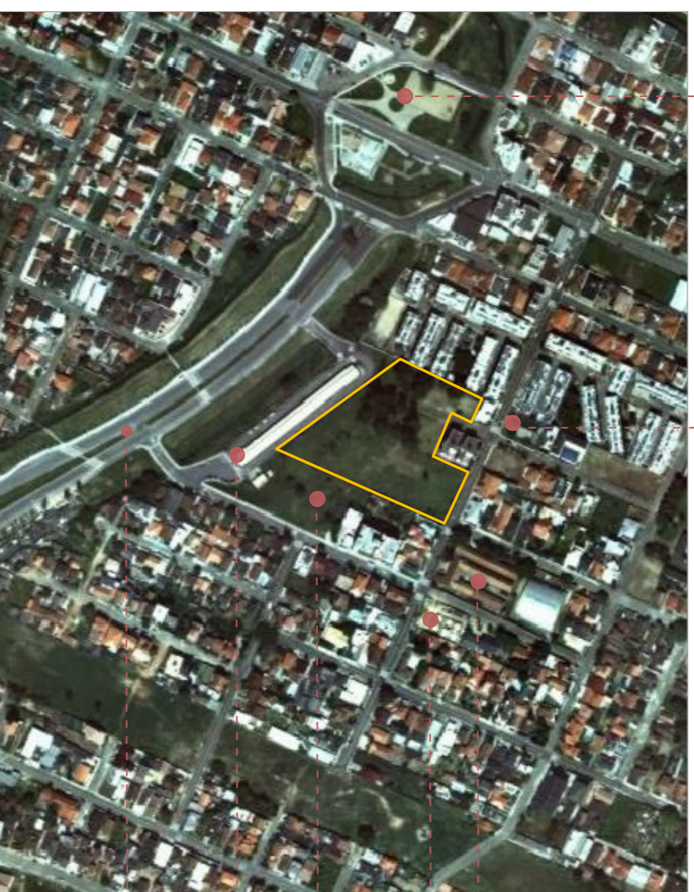
Área de intervenção e entorno