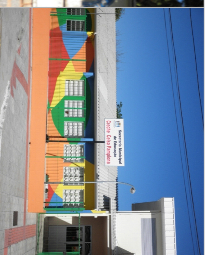
Creche Celso Pamplona