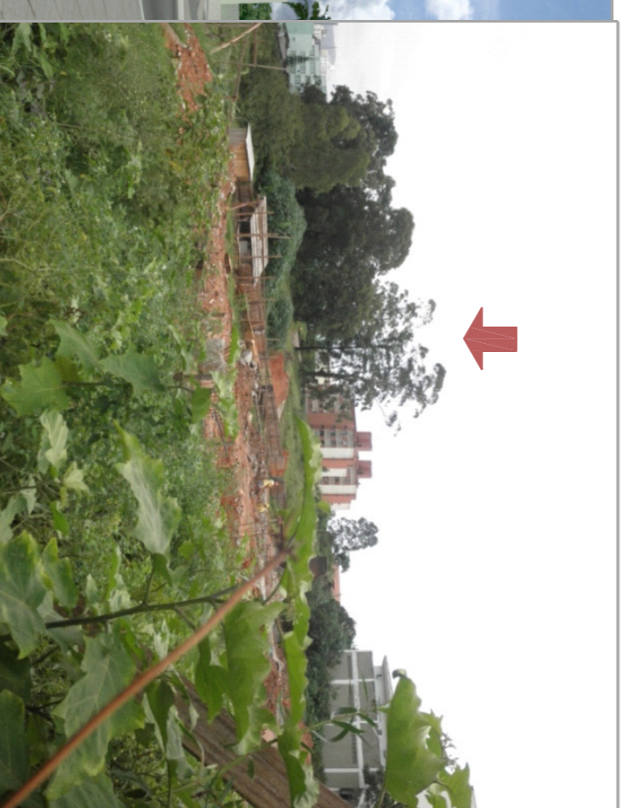
Canteiro de obras UPA Continente-terreno da proposta ao fundo