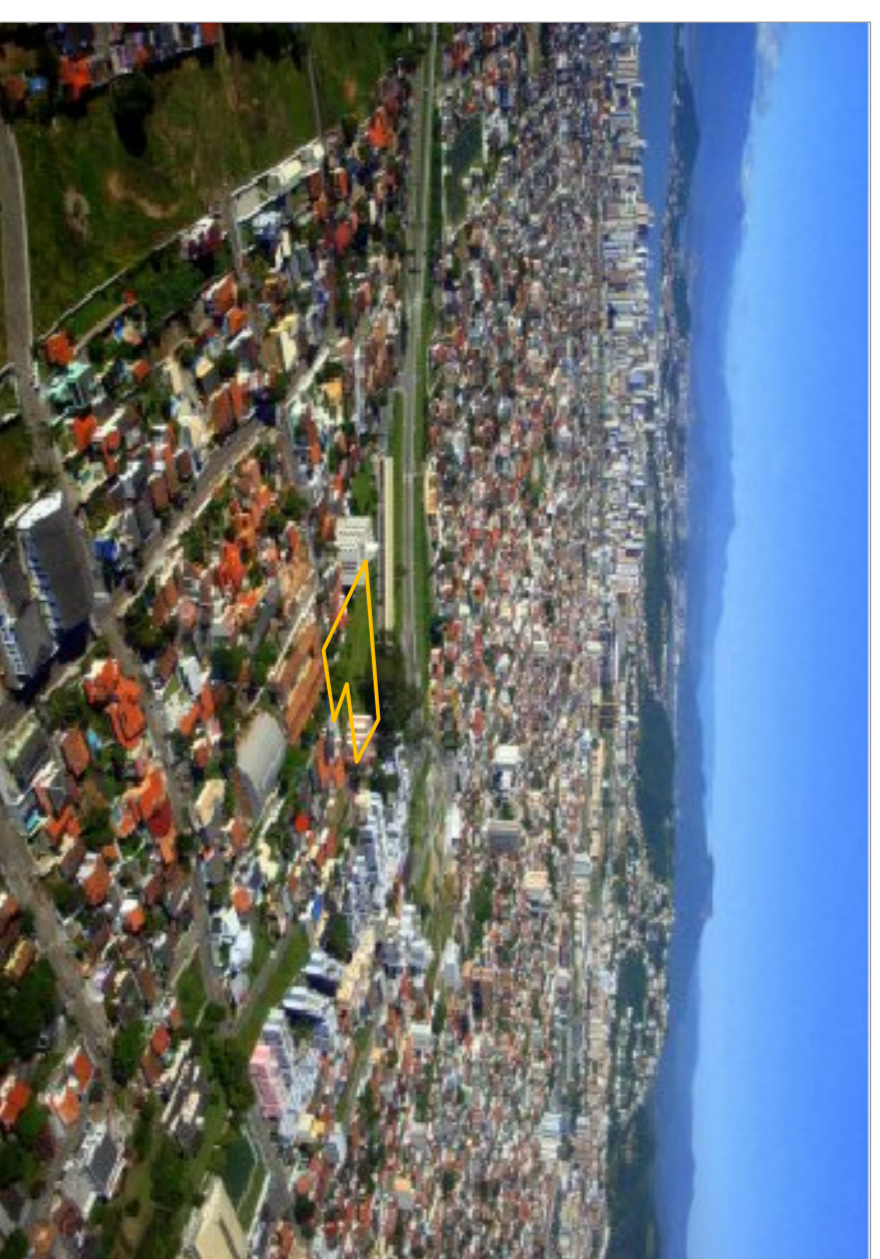
Vista da área de intervenção

Assim, o objetivo desse trabalho de conclusão de curso é propor um Centro de Atividade Física, no bairro do Jardim Atlântico, na porção continental do município de Florianópolis, que ofereça aos usuários a oportunidade de desenvolver atividades físicas orientadas que promovam o lazer, a inclusão social e contribuam para a promoção da saúde e melhoria da qualidade de vida das pessoas.