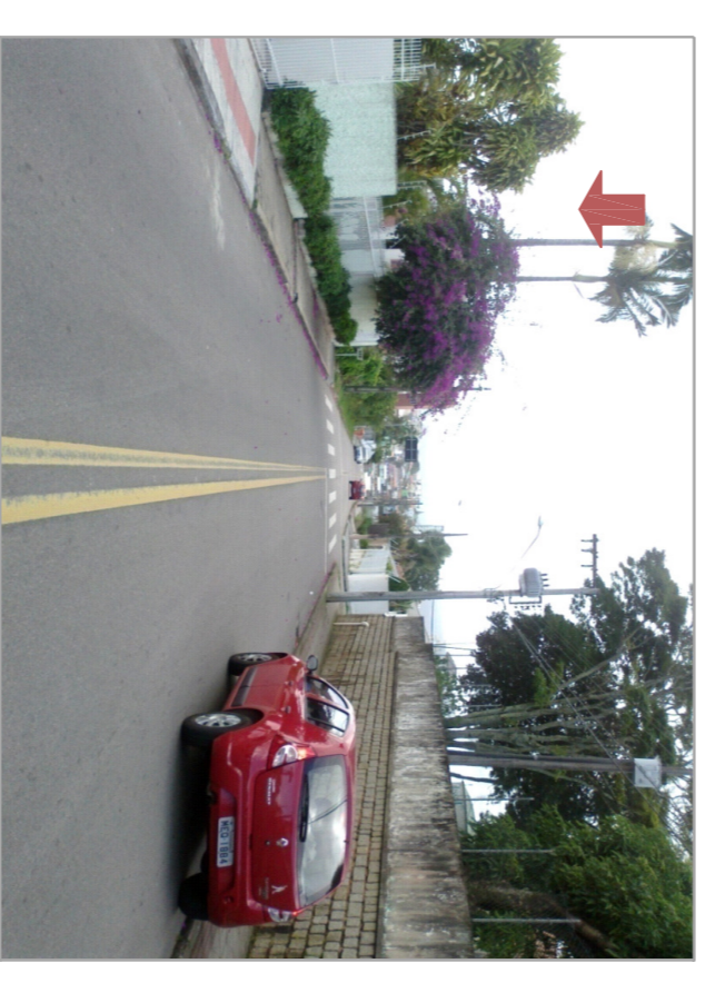
Vista Rua Manoel Pizzolati