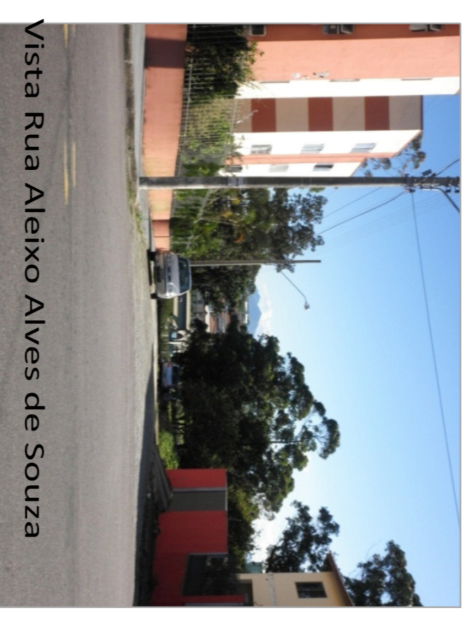
Vista Rua Manoel Pizzolati