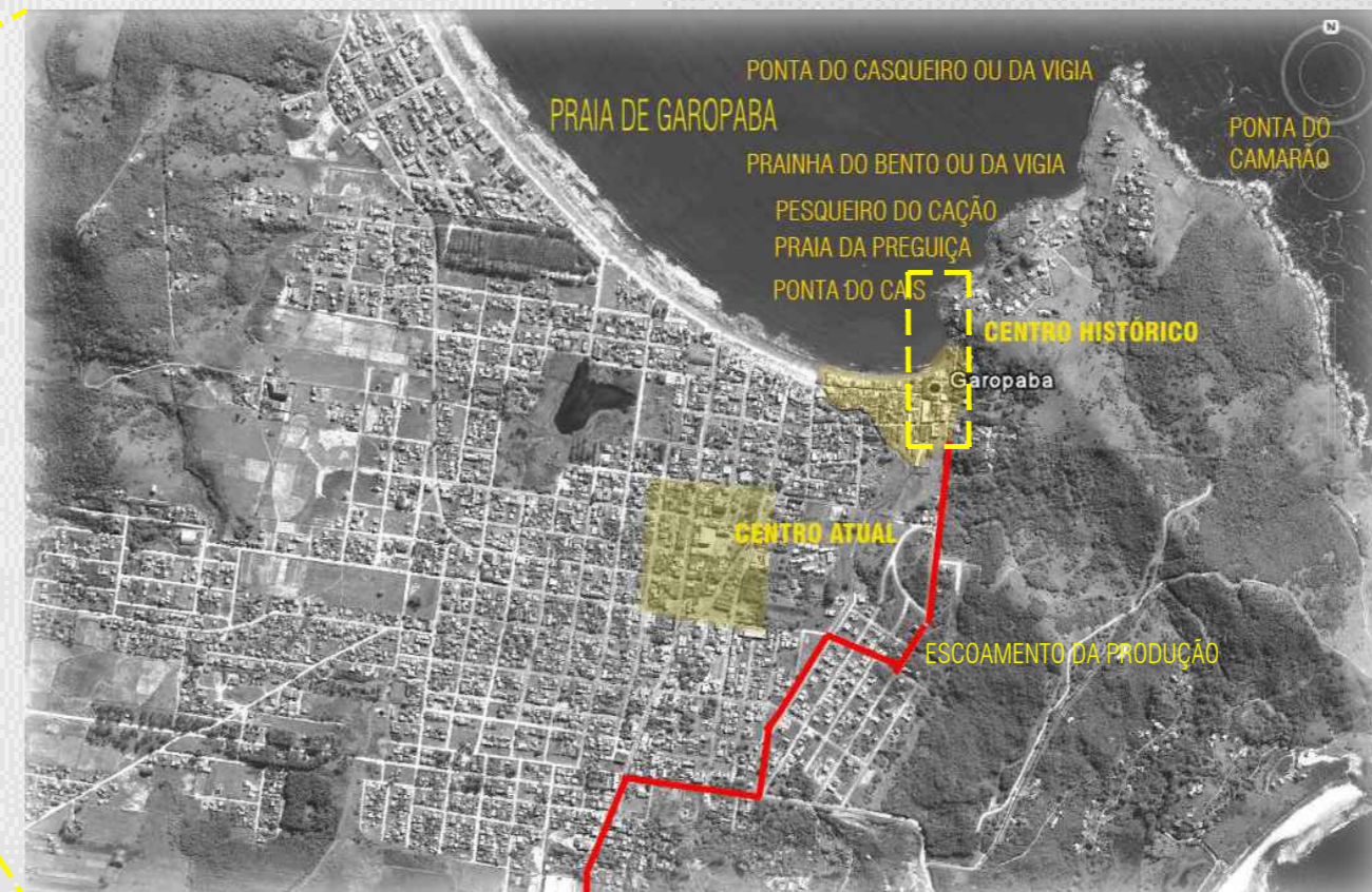
MAPA 04- APROXIMAÇÃO AO CENTRO.