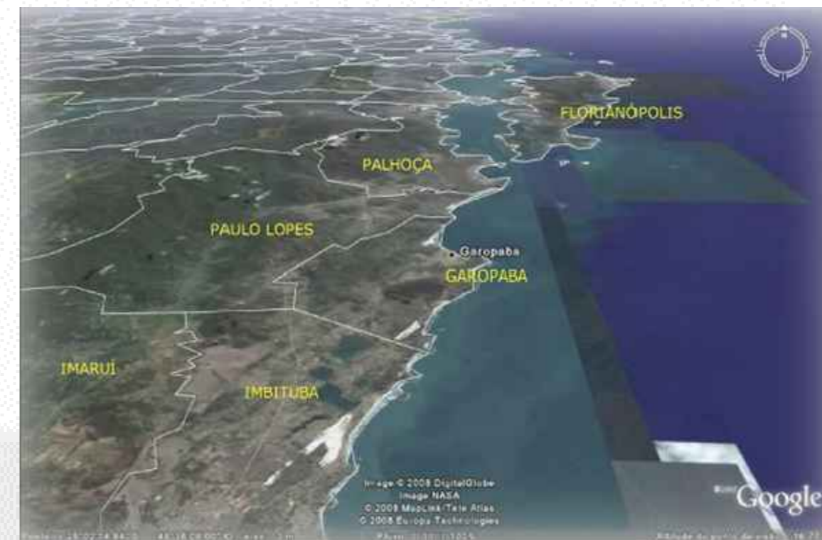
MAPA 02- DIVISAS DO MUNICÍPIO

O MUNICÍPIO DE GAROPABA LIMITA-SE AO NORTE E AO OESTE COM O MUNICÍPIO DE PAULO LOPES, AO SUL COM O MUNICÍPIO DE IMBITUBA E AO LESTE COM O OCEANO ATLÂNTICO.