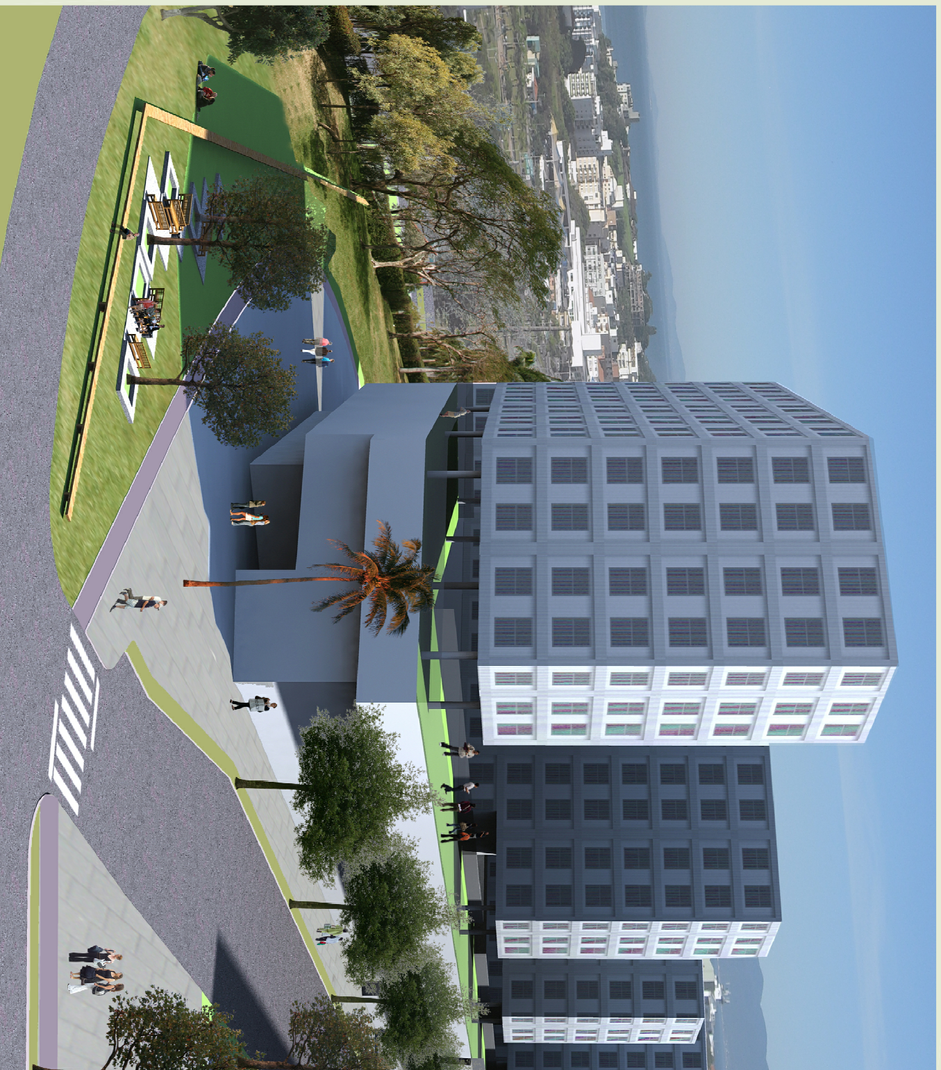
Imagem da orla em direção ao bairro. Simulação da ocupação máxima da área a ser adensada. Parque linear que liga a Orla Marítima ao bairro.

Este setor compreendia uma área associativa com baixíssima densidade. Por se tratar de uma região suprida por infra-estrutura, a proposta foi aumentar os índices e desenhar um embasamento comercial e de serviços, totalmente aberto ao público, que possibilite a transposição até o parque linear que faz o amortecimento entra a área e a via de trânsito rápido.