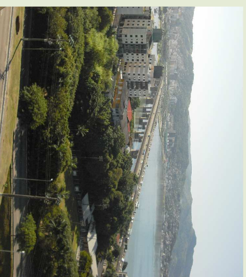
Foto da atual ASDERLIC (Associação dos Servidores do DER Litoral Centro). Foto tirada a partir do bairro em direção à orla.