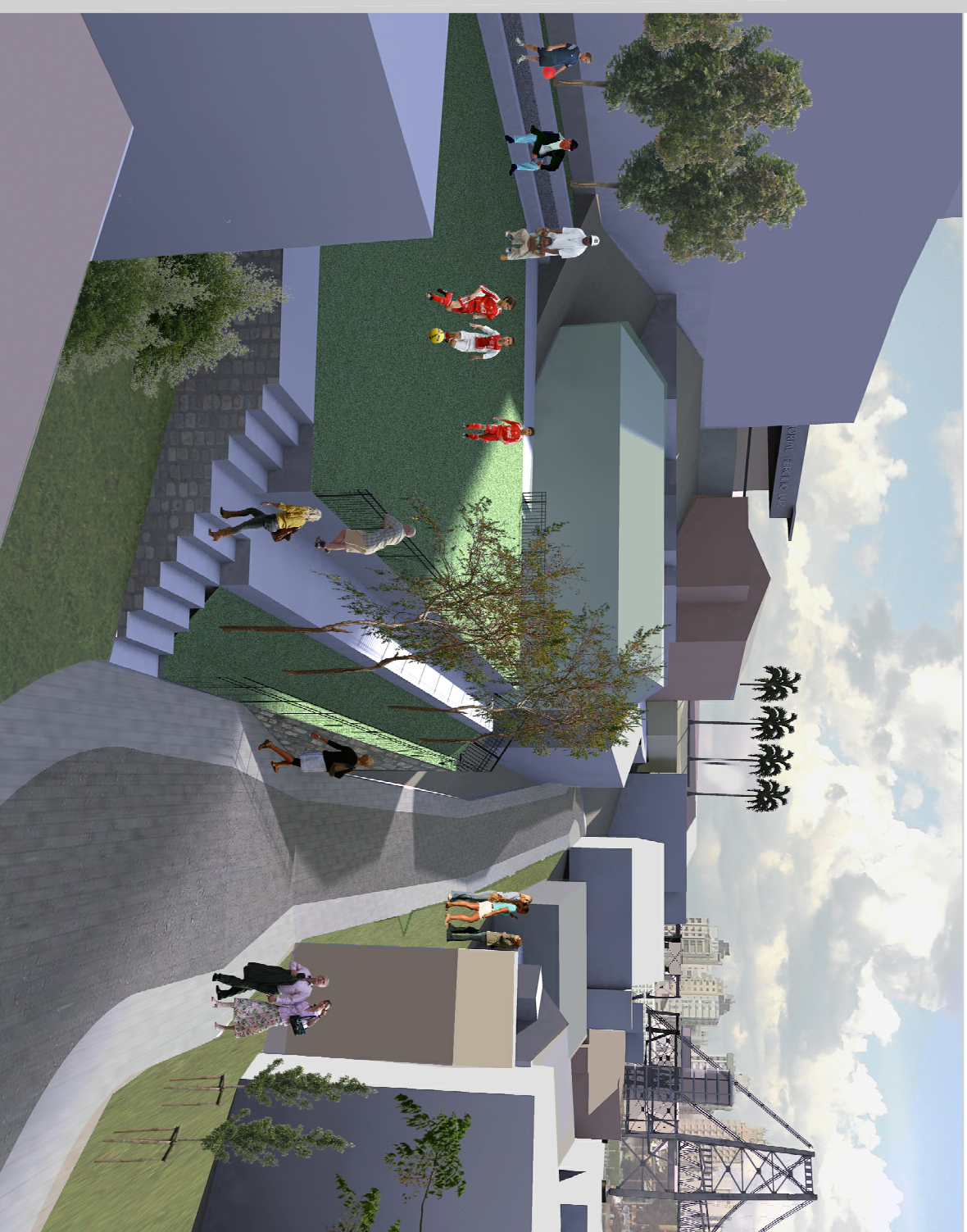
Perspectiva da via aberta em paver para veículos acessarem as casas. À esquerda capinho para lazer comunitário construído em terreno ocioso.