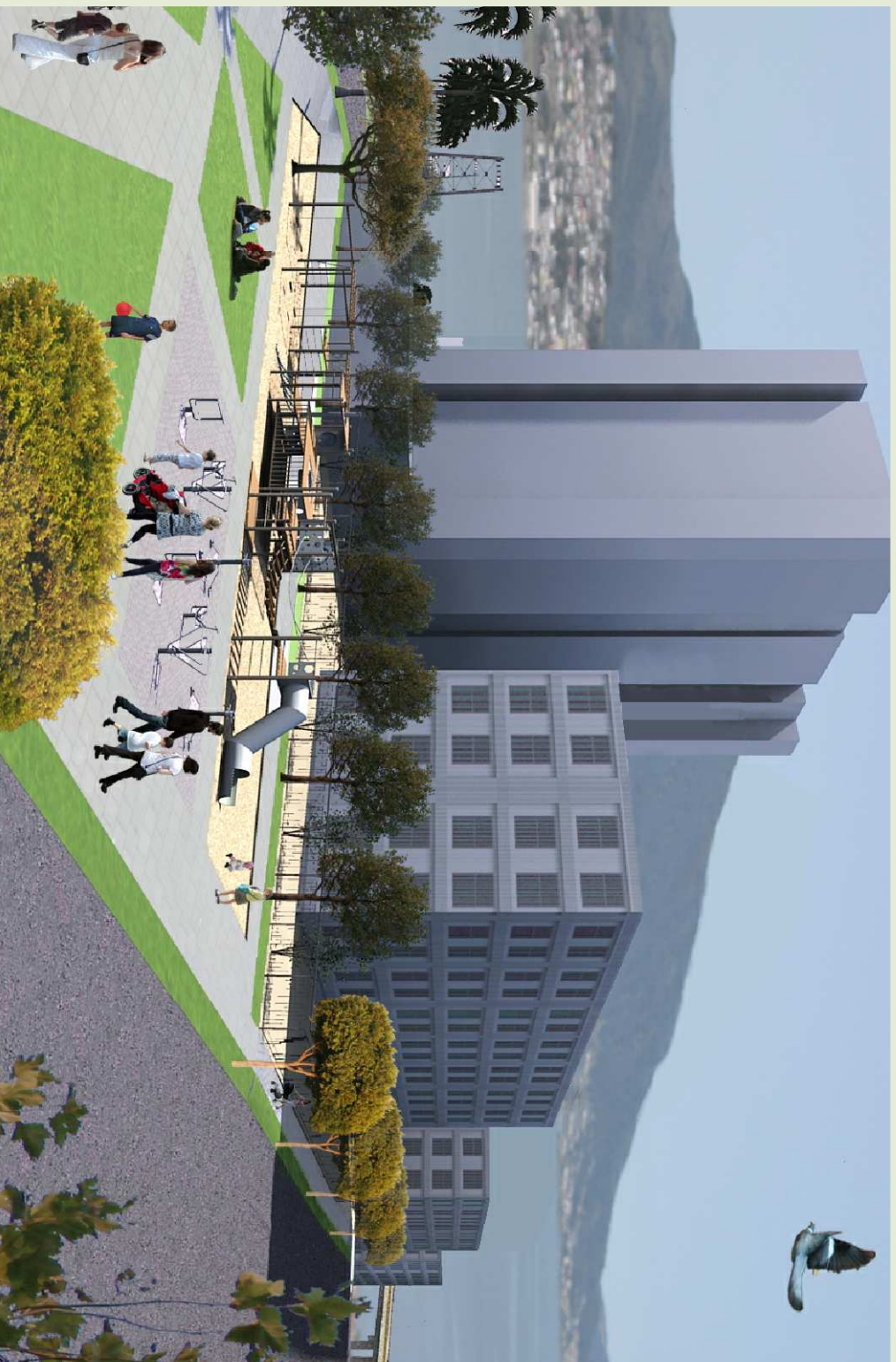
Perspectiva da Praça Local. Ao fundo Boulevard Hercílio Luz e Prédio de Habitação de Interesse Social.

Este setor compreende uma área destinada para habitação de interesse social. A instauração deste uso visa a manutenção da população tradicional na área que terá o solo valorizado depois das intervenções.