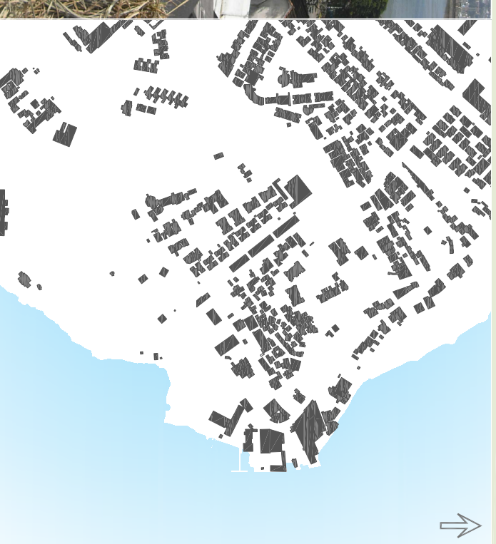
Mapa de Cheio e Vazios - Nota-se a baixa densidade da área de intervenção.