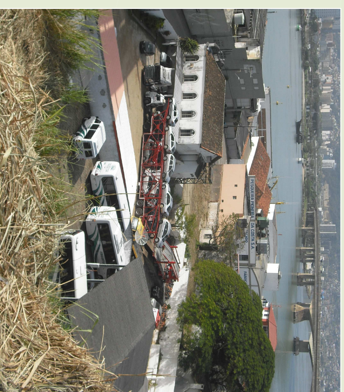
Foto da Orla Marítima a partir da Ponte Hercílio Luz. Empresa Itaguatur, casa histórica de 1921 e indústrias pesqueiras.