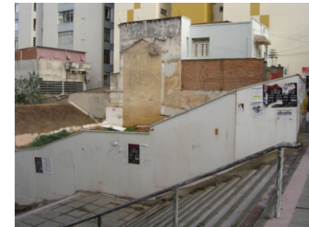
VISTAS DO TERRENO.