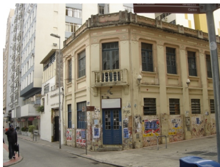
VISTA CASA E TERRENO.

TERRENO ABANDONADO, COM CONEXÃO DIRETA A CASA SITUAÇÃO ATUAL: ABANDONADO COM SINAIS DE DEPREDAÇÃO