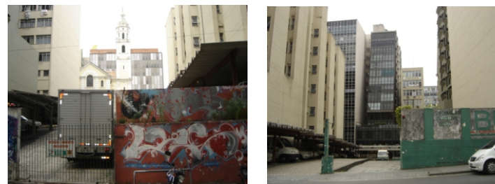
VISTAS FUNDOS E ENTRADA DO ESTACIONAMENTO.

ESTACIONAMENTO DE CARROS. SITUAÇÃO ATUAL: EM USO