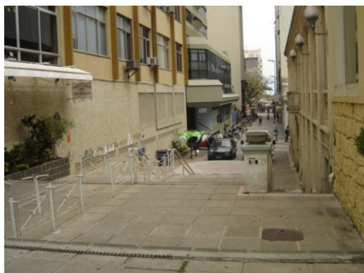
VISTAS DA RUA TRAJANO PELA ESCADARIA DO ROSÁRIO.