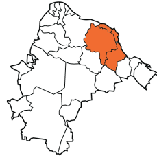
Fig. 20: Região Sudeste - principal mercado atacadista abastecido pela produção catarinense

Mercaflor: é um centro de comercialização recente, localizado no município de Joinville. Funciona como um mercado, permitindo aos produtores de plantas ornamentais, flores e afins comercializar seus produtos para clientes profissionais cadastrados, como paisagistas, decoradores, floristas e atacadistas de linha (que fazem rotas por todo o país). Os produtores associados são produtores da região, como Biguaçu, Corupá, Laurentino e ainda alguns do Estado do Paraná. O processo comercial se dá duas vezes por semana, apresentando uma grande diversidade de produtos (plantas de jardim, grama, caixaria, flores de corte, bulbos e sementes, flores e plantas envasadas e insumos para floriculturas).