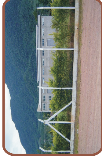
Distrito Industrial