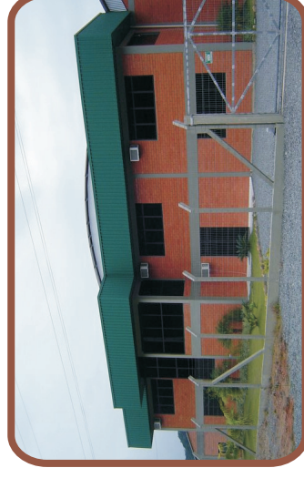
Distrito Industrial