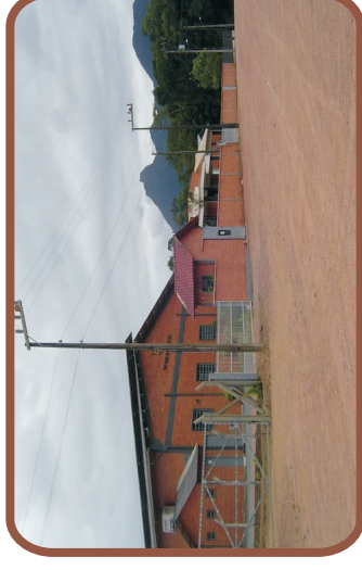
Distrito Industrial