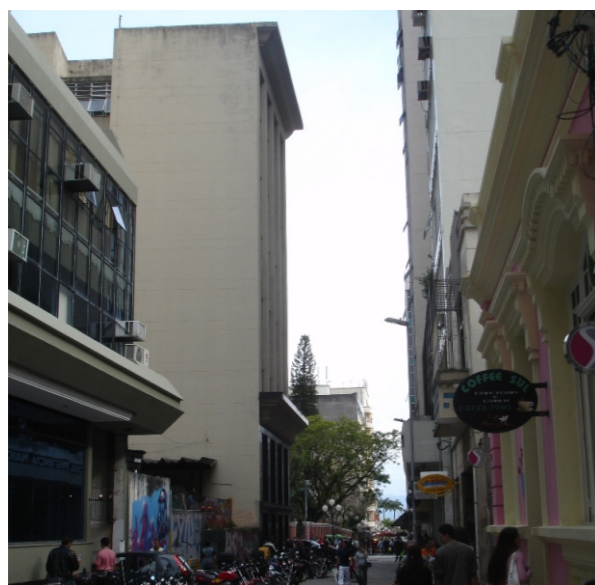
Foto do terreno e entorno a partir da rua Trajano, mostrando diversos usos: institucional, serviços e comércio.

A instalação do centro cultural poderá também solucionar o problema do "abandono" do centro histórico durante a noite (o qual se torna um pouco perigoso devido ao menor trânsito de pessoas) através de instalações que possibilitem usos e atividades noturnas.