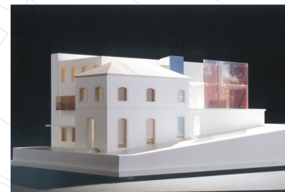
Maquete do projeto de ampliação do Museu. Arq. Peter Widmer.