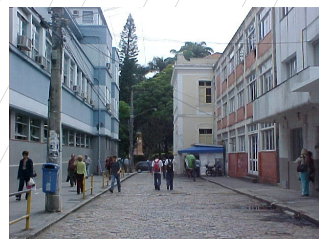
Malha viária - rua Victor Meirelles.

A malha viária da área é um elemento fundamental para a composição da imagem local, pois não foi alterada durante o período de desenvolvimento urbano entre as décadas de 60 e 80. Sem dúvida este é um patrimônio a ser preservado para as futuras gerações, pois expressa a memória da paisagem da cidade do século XVIII.