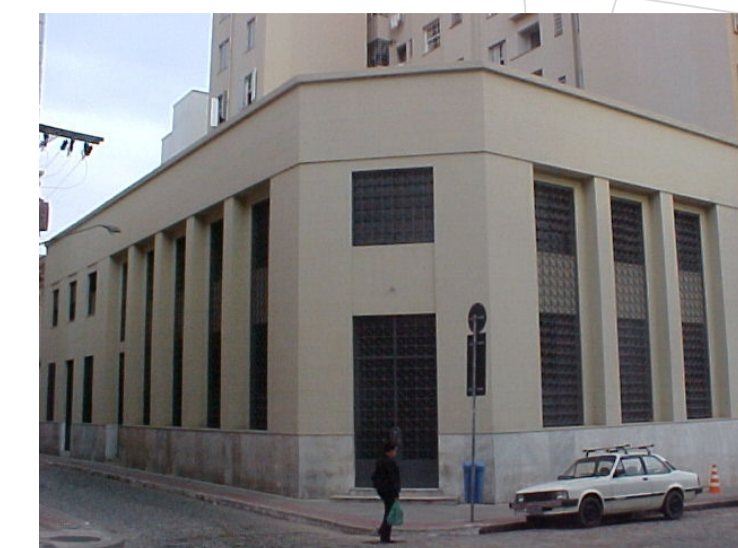
Edifício reformado para abrigar o Centro Cultural Florianópolis.

Outro fato que contribuirá para o reforço do caráter cultural da área é a criação do Centro Cultural Florianópolis, Arquivo Histórico Municipal.