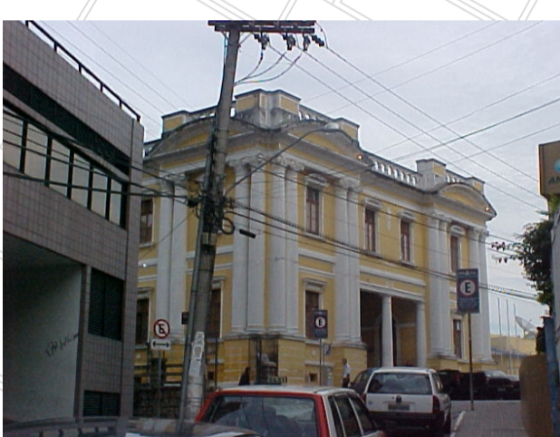
Fiação elétrica aparente.

Além disso, a área não possui espaços públicos de grande porte, como praças ou parques, sendo as ruas o espaço que o cidadão possui para se apropriar.