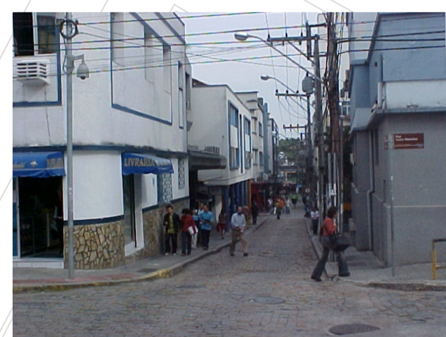
Fiação elétrica aparente - rua Saldanha Maranhão.

No entanto, a situação física em que a malha viária se encontra atualmente não valoriza a importância que a mesma possui. Fiações elétricas áreas, trânsito e estacionamentos inadequados, pavimentação deteriorada, entre outros fatores, contribuem para a degradação da imagem local.