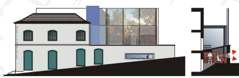
Projeto de ampliação do Museu Victor Meirelles. Arq. Peter Widmer.