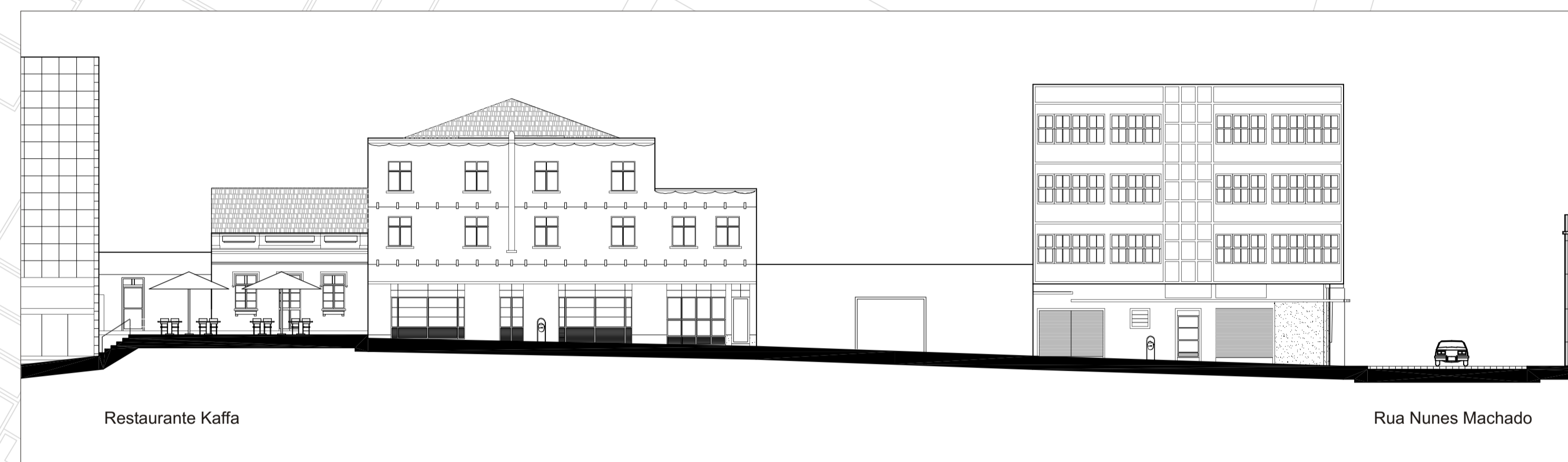
ELEVAÇÃO NORDESTE - Esc. 1/200