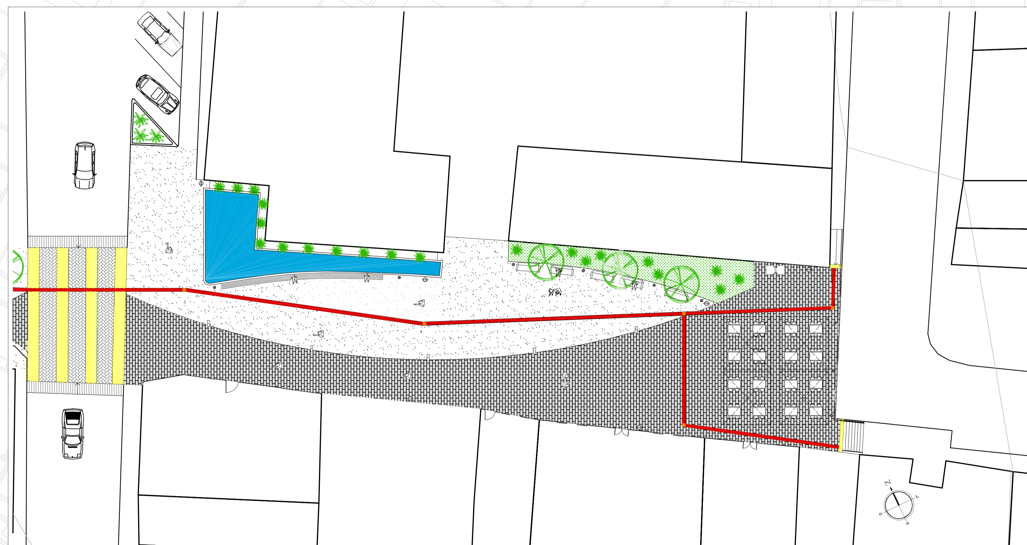
PLANTA BAIXA - Esc. 1/200