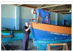
Restauração de baleeiras

Motores de Popa e Rabetas Motores de Popa e Rabetas em promoção, tudo em 10X sem juros! www.superrede.com.br