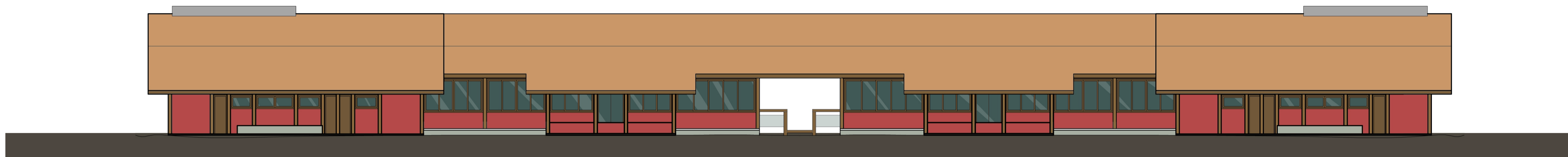
FACHADA SUL ESC. 1:125