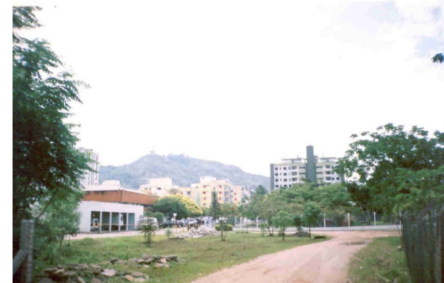
Vista do entorno