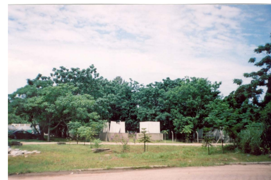
Vista do terreno