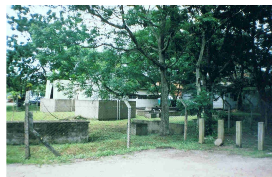
Vista do terreno