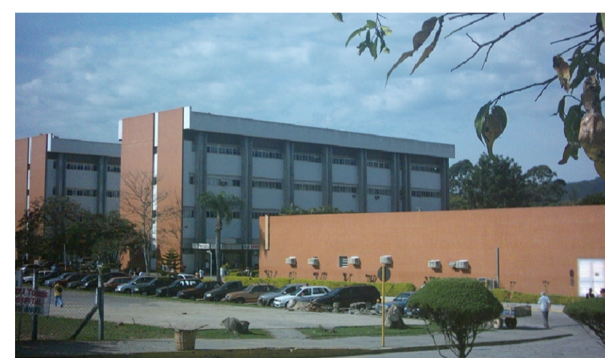
Hospital Universitário