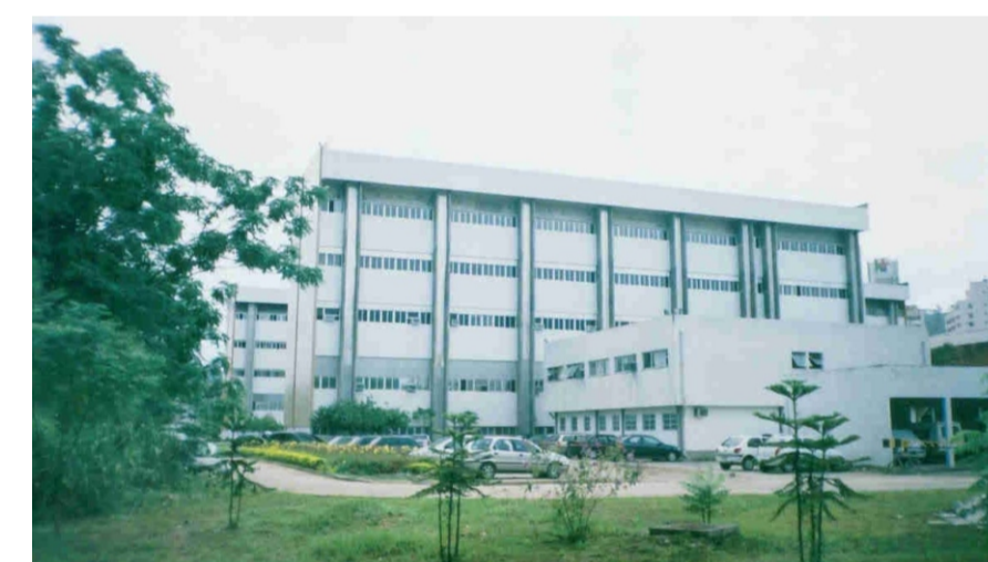
Hospital Universitário