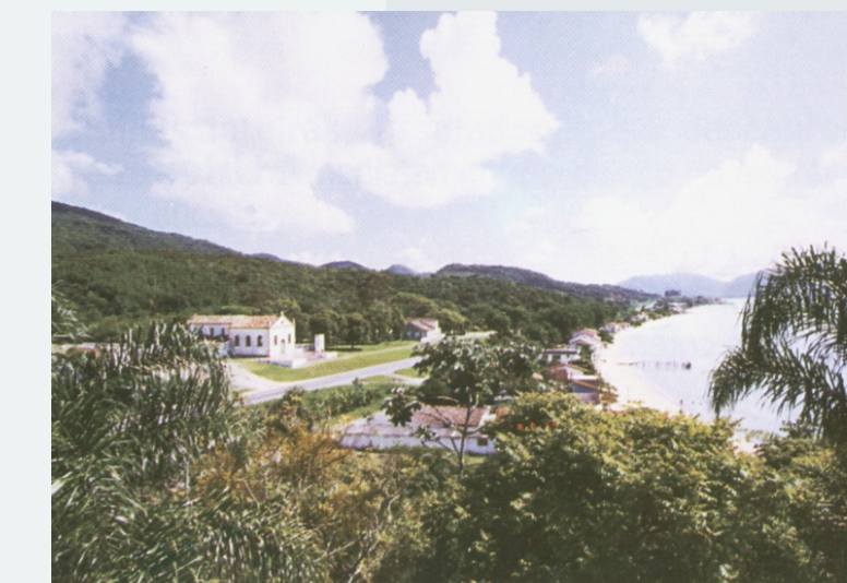
VISTA GERAL DA ÁREA DE ESTUDO (Fonte 1)

São Miguel permite que se olhe para seu interior e sinta a tradição a espisar das janelas de suas construções antigas e, ao mesmo tempo, que se descubram inúmeras conquistas a acenar no brilho das ondas que chamam para aventuras no oceano que lhe banha as areias.