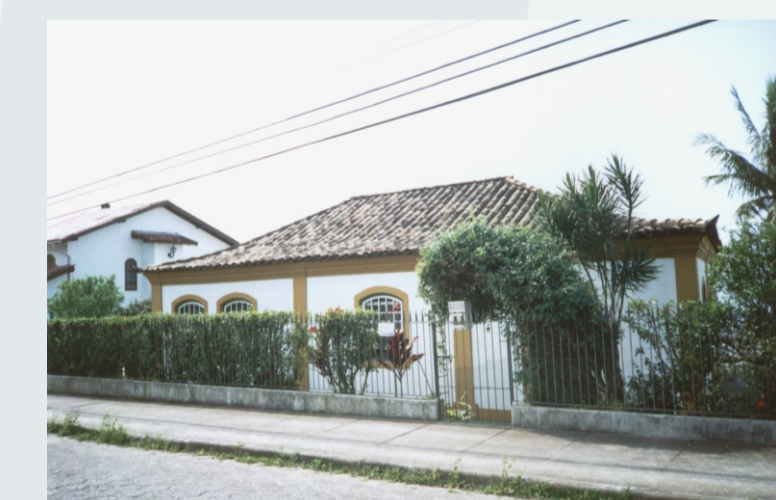
ÚNICA CASA REMANESCENTE DA ÉPOCA