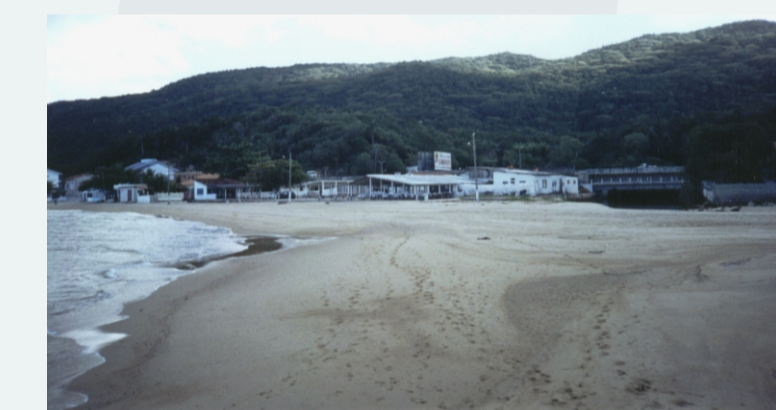
VISTA DO RESTAURANTE SOMBRERO