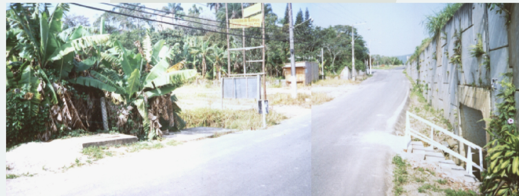
DEFICIÊNCIA - VIA MARGINAL QUE LEVA À PRAIA COM ACESSO À ÚNICA PASSAGEM SUBTERRÂNEA DE PEDESTRES QUE CRUZA A BR - 101