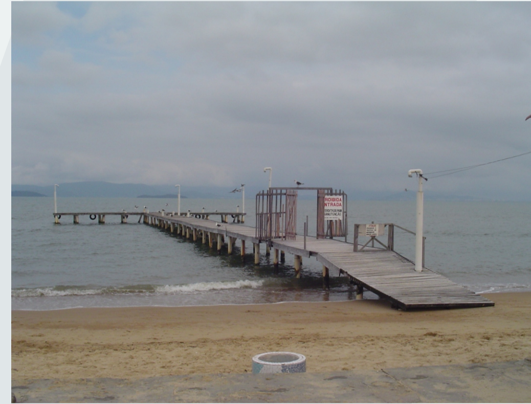
POTENCIALIDADE - POSSIBILIDADE DE ACESSO POR VIA MARÍTIMA