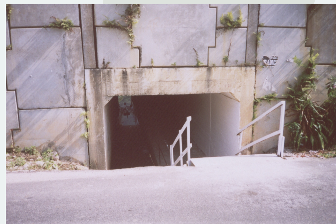
DEFICIÊNCIA - ENTRADA DA PASSAGEM SUBTERRÂNEA DE PEDESTRES

Potencialidades (aspectos que facilitam a integração do local num projeto mais amplo de desenvolvimento)