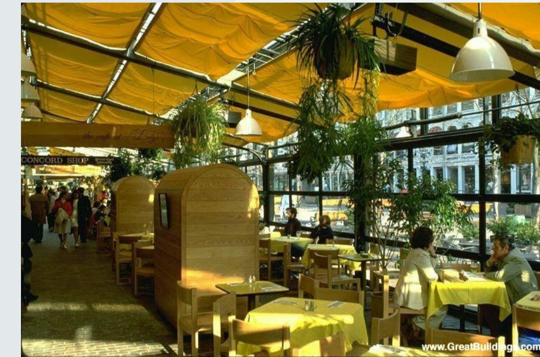
Faneuil Hall Marketplace - COMUNICAÇÃO ENTRE O INTERIOR E O EXTERIOR PROPICIADO PELO USO DO VIDRO (*)