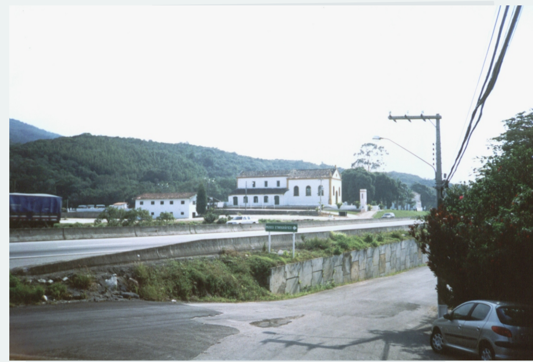
POTENCIALIDADE - VALOR DE MEMÓRIA (EDIFICAÇÕES HISTÓRICAS)

- Diferencial em relação a outras cidades do litoral por aliar riquezas naturais e patrimônio histórico.