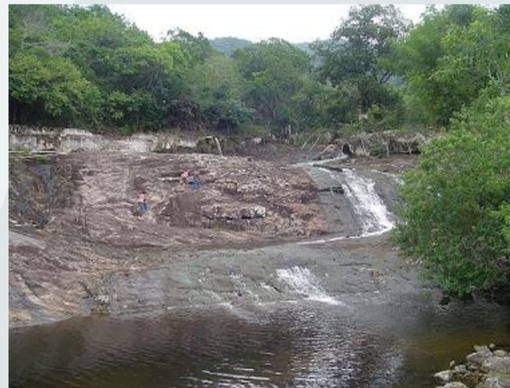
POTENCIALIDADE - RIQUEZA NATURAL DO LUGAR