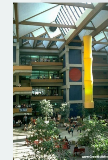
Bateson Building - ESPAÇO DE CONVÍVIO DE PESSOAS ILUMINADO POR LUZ NATURAL (*)