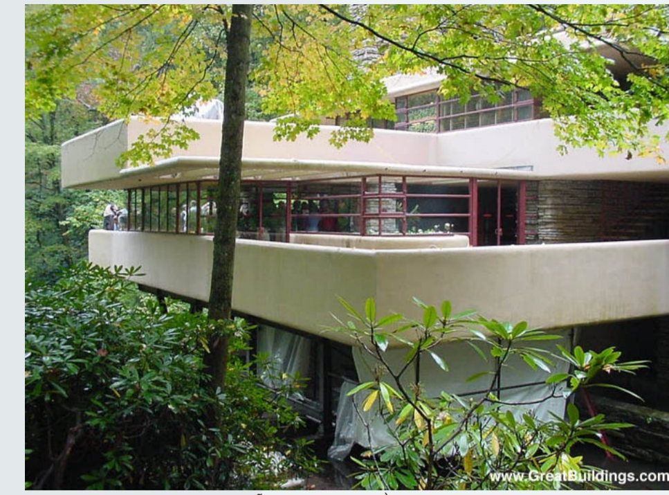
Fallingwater - CONSTRUÇÃO INTEGRADA À NATUREZA TANTO NAS FORMAS QUANTO NOS MATERIAIS. SEM AGREDI-LA (*)