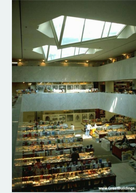
Academic Bookshop - GRANDE ÁREA CENTRAL ILUMINADA POR LUZ NATURAL (*)