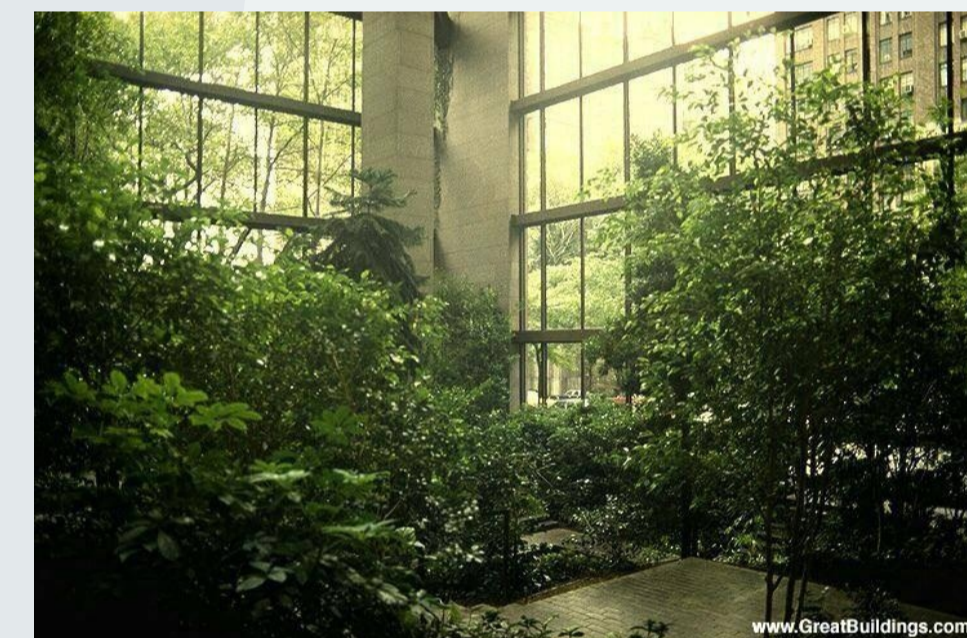
Ford Foundation Building - COMUNICAÇÃO DO INTERIOR COM O EXTERIOR E USO DE VEGETAÇÃO DENTRO DO ESPAÇO CONSTRUÍDO (*)

Formular uma proposta de protótipo de espaço de convivência capaz de alcançar um grande número de pessoas e estabelecer entre elas trocas vivenciais e culturais, capaz de oferecer-lhes oportunidades de crescimento econômico, de ampliação do conhecimento, de contatos enriquecedores, apresenta-se para mim como um desafio envolvente que aqui me proponho alcançar. Com esse objetivo, dediquei-me a conhecer melhor a realidade do espaço que me serviu de motivação (a região de São Miguel), para, a partir de um olhar mais abrangente, poder estabelecer os pontos centrais de meu projeto. A primeira definição, a nortejar o desenvolvimento do todo, é a adoção de características arquitetônicas que se harmonizem com os espaços já existentes na localidade e se integrem na natureza, abrindo nichos de luz e cor, de vegetação, ambientes que se completem. Para dar forma a essa construção idealizada, parti do diagnóstico da realidade local, do qual alguns pontos podem ser destacados.