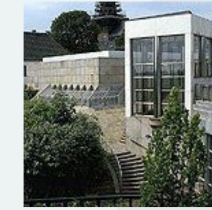
Ableiburg Museum - FORMAS E MISTURA DE MATERIAIS (*)