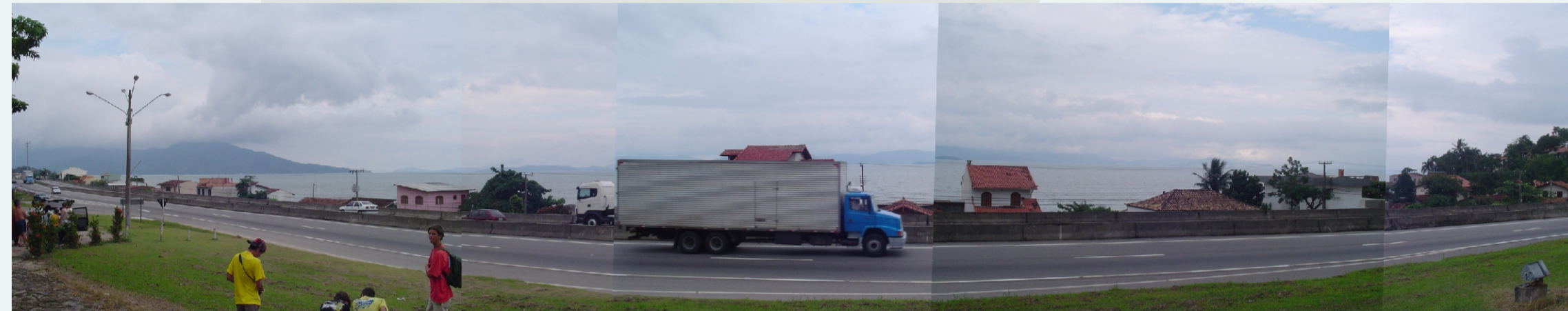
DEFICIÊNCIA - BR - 101 PASSANDO EM FRENTE À IGREJA E AO MUSEU ETNOGRÁFICO, SECCIONANDO A VILA EM DUAS PARTES QUE NÃO SE COMUNICAM

- Inexistência de conexão entre os diferentes pontos que as pessoas freqüentam (igreja, museu etnográfico, parque, aqueduto, cachoeira, restaurantes e praia).