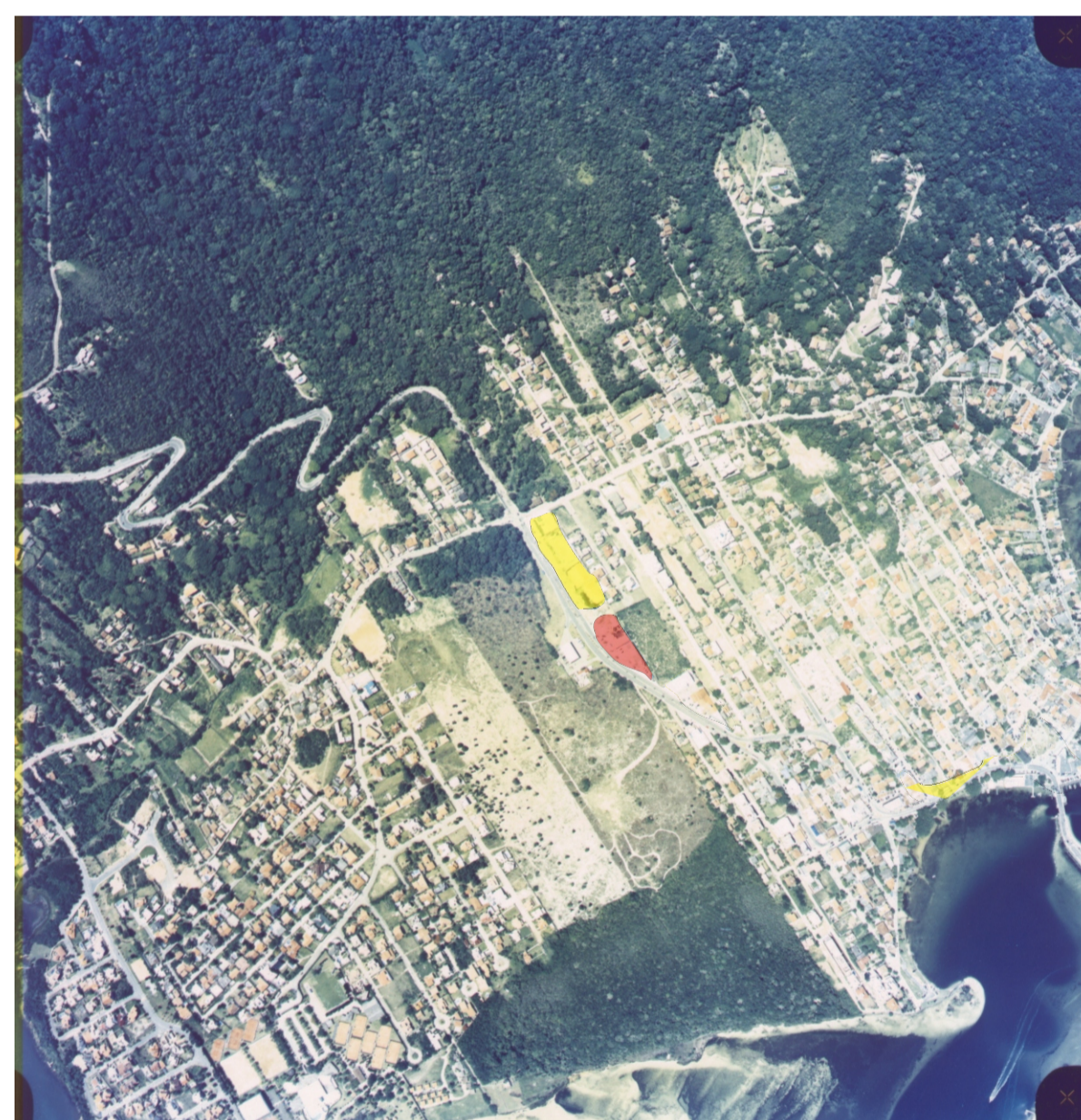
Mapa mostrando as áreas com maior fluxo de pessoas durante o dia e a noite.