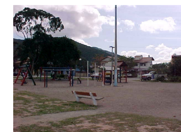
Áreas de estar e Lazer: Pracinha