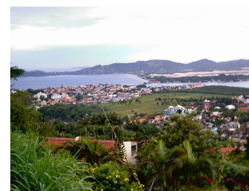
Áreas Verdes: Vista da Lagoa