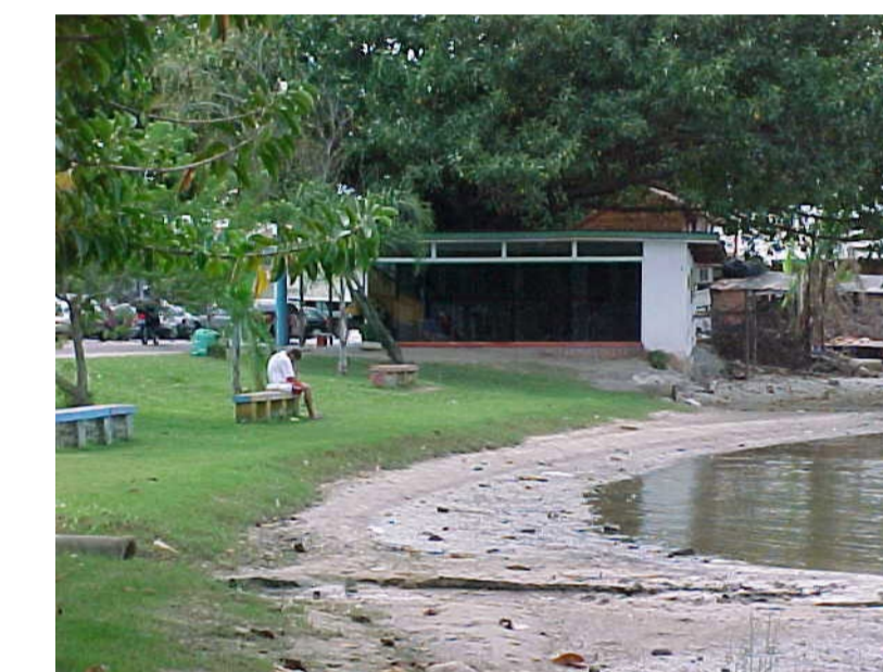
Trechos de Estar na Orla