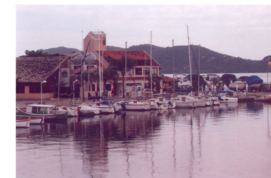
Áreas de estar e Lazer: Trapiches