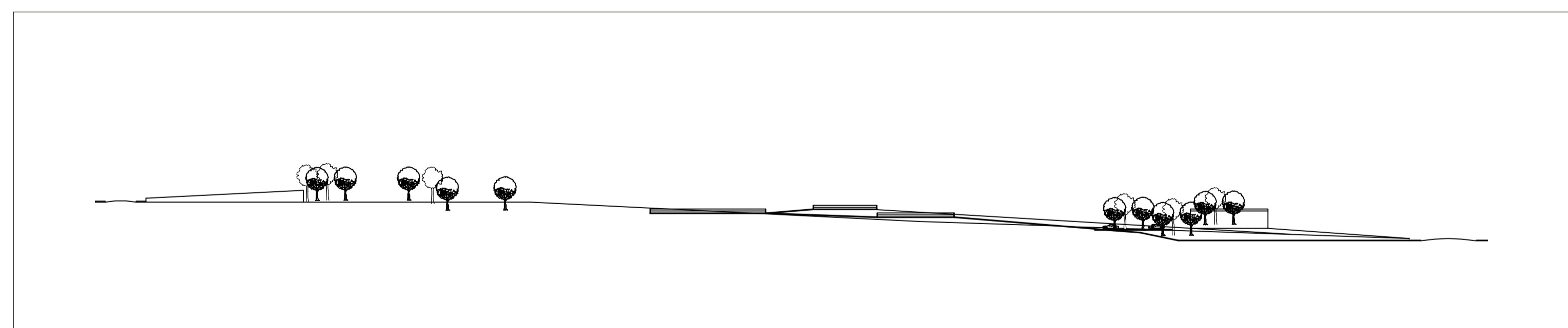
CORTE C-C' Esc. 1/1000