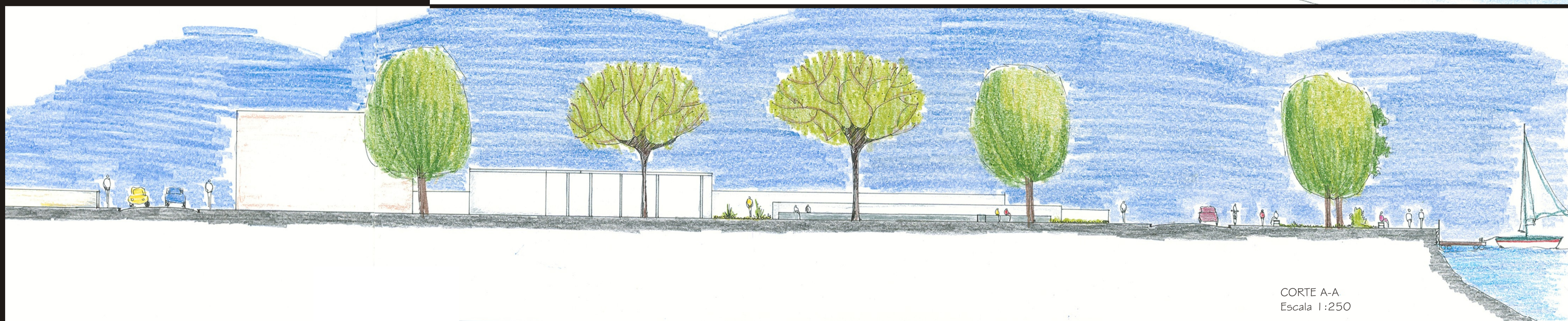
CORTE A-A Escala 1:250