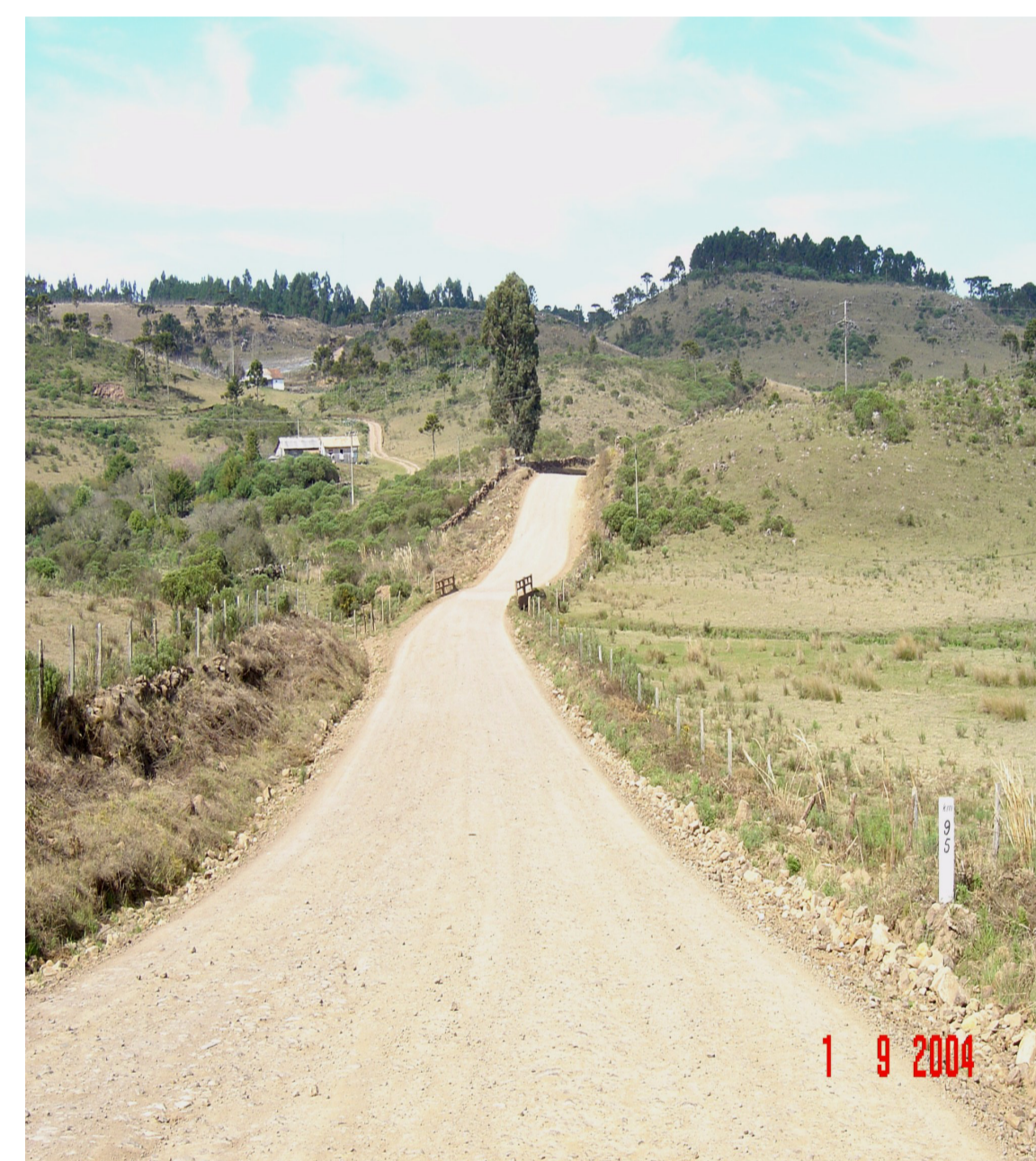
Estrada de chão na Zona Rural de São Joaquim.