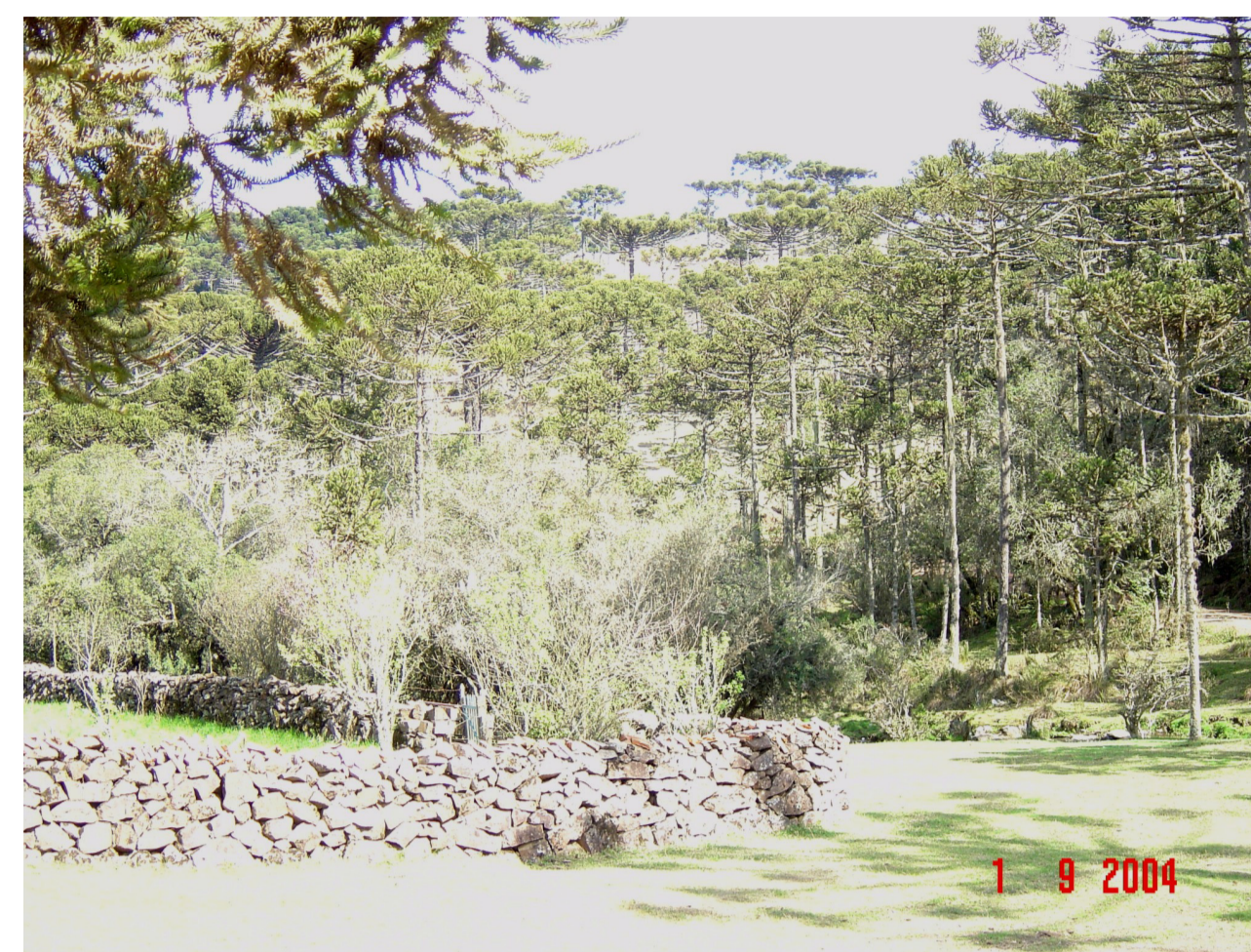
Zona Rural de São Joaquim. Paisagem com Araucarias e taipa - muro de pedra típico da região.