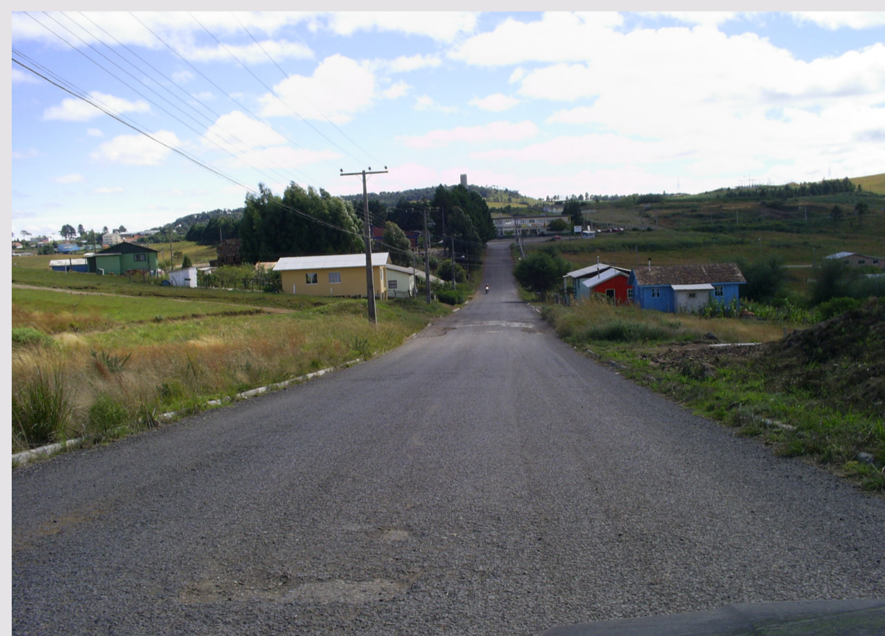
Rua Manoel F. de Oliveira, situada na Zona de Transição.