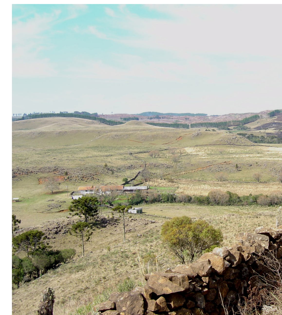
Paisagem da Zona Rural de São Joaquim.