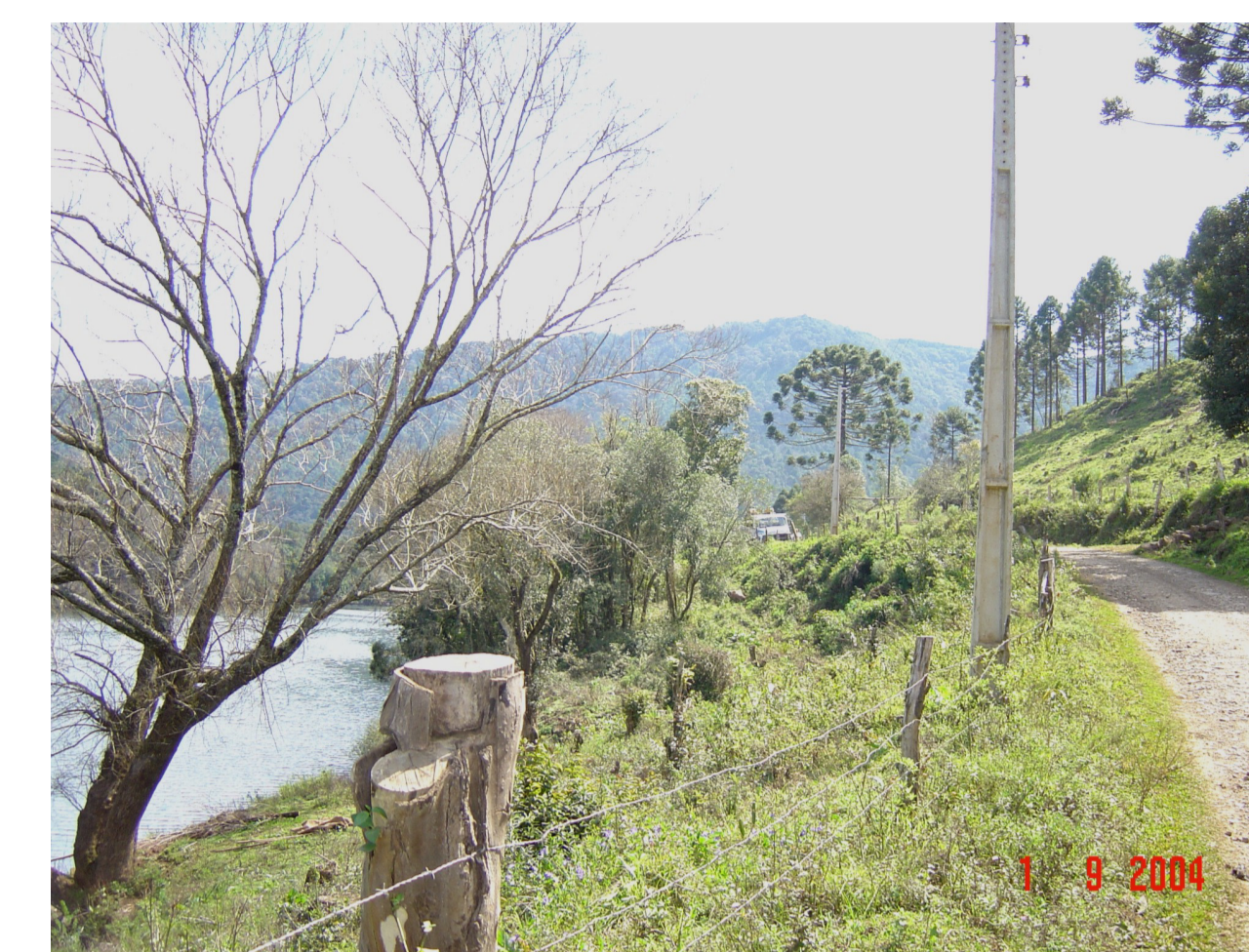
Zona Rural de São Joaquim. Rio Pelotas, divisa entre São Joaquim e o estado do Rio Grande do Sul.