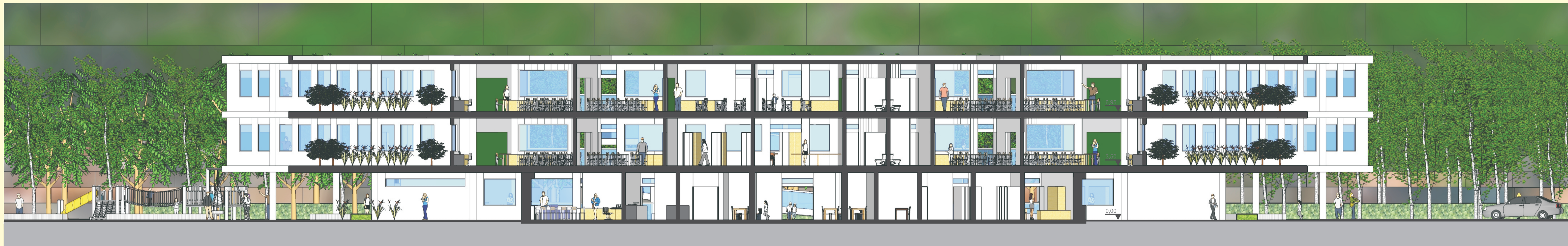
CORTE AA' ESCALA 1/125