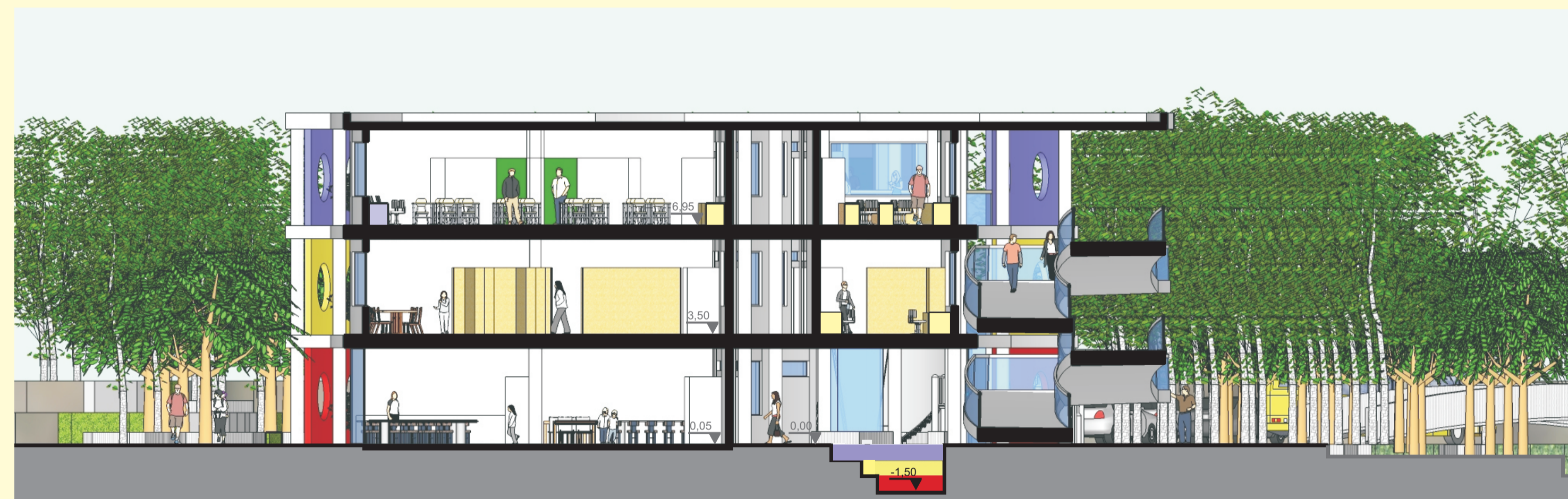
CORTE BB' ESCALA 1/125