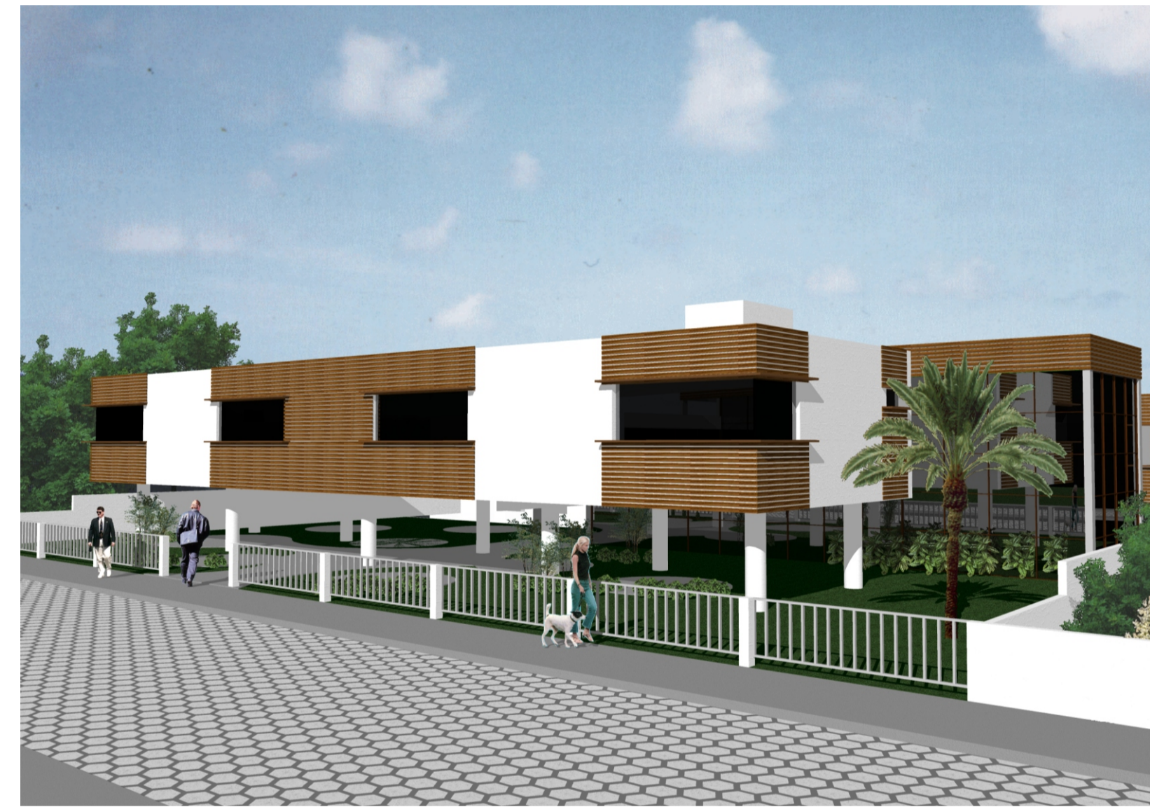
Vista da Av. Madre Benvenuta