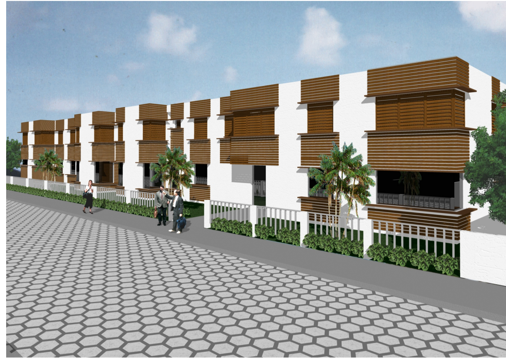
Vista da Rua Mto. Vespasiano Souza