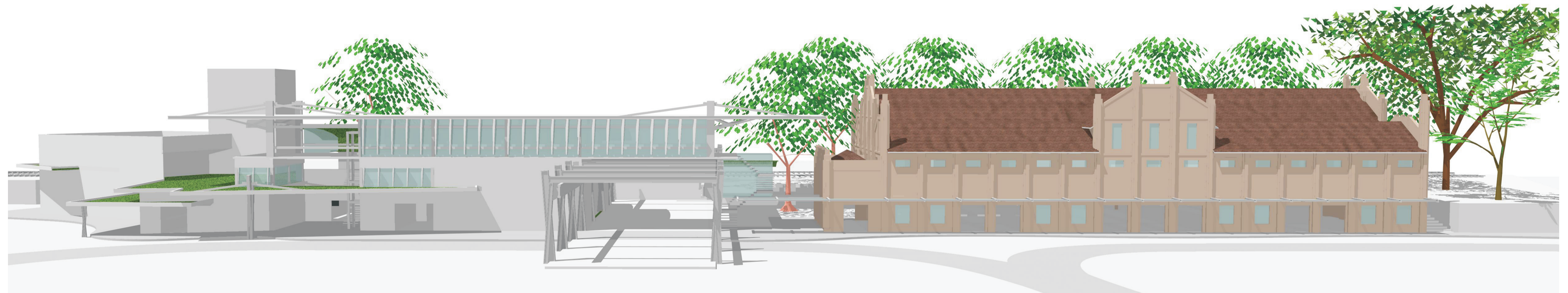
FACHADA OESTE escala 1:250